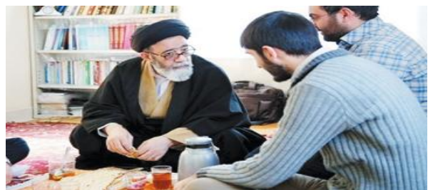
امام جمعه تبریز پای درد دل جوانان