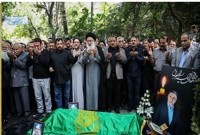
وداع / آخرین خبر افشار