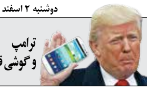
ترامپ و گوشه قدیمی‌اش