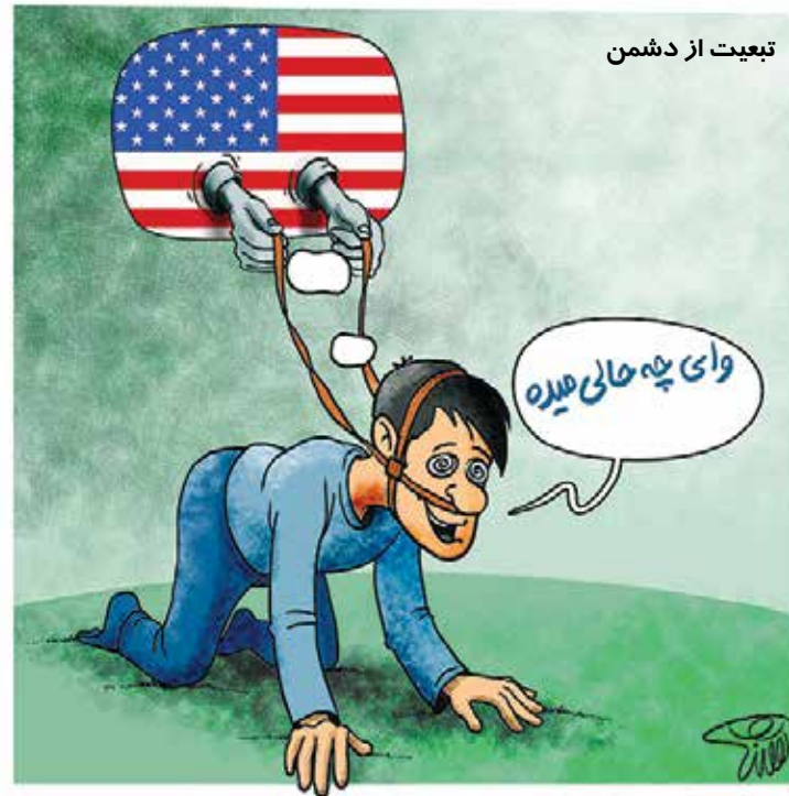
تعبیرت از دشمن