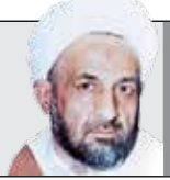
به نقل از حضرت آیت‌الله‌عظمی خامنه‌ای(۸۰/۹/۱۳)

در ایامی که سوستگرد آزاد شده بود، ما به سوستگرد رفیقیم. بنده اهواز بودم، می‌خواستم بروم سوستگرد، لباس نظامی تنم بود. در این بین دیدیم آقای مدنی در اهواز پیدا شد؛ در تهران آمده بودند و ابعداً آمدند سراغ ما. گفتند: کجا می‌رویید؟ گفتیم می‌رویم سوستگرد. گفتند: من هم می‌آیم. ایشان را هم با خودمان برداشتیم و رفیقیم سوستگرد در آنجا ظهر نماز را که خواندیم، من یک قدری با مردم صحبت کردم. خوب، طبعاً من فارسی حرف می‌زدم و نمی‌توانستم نطق عربی از تر بکنم، آن هم به خصوص با لهجه عمومی و مردمی. ایشان گفت من با مردم حرف می‌زنم و منتظر نشد، چون جمعیت مسجد بعد از اینکه من صحبت کردم، تقریباً متفرق شد؛ رفت بین مردم، یک وقت دیدیم یک جماعت عظیمی از زن و مرد را دور خودش جمع کرده و دارد با لهجه هجره عربی با اینها حرف می‌زند! یک سخنرانی حاسنی گرم آنجا کرد که مردم را به هیجان آورد.