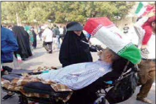
دلیل چهل سال بقای انقلاب اسلامی وجود چنین مردانی است...