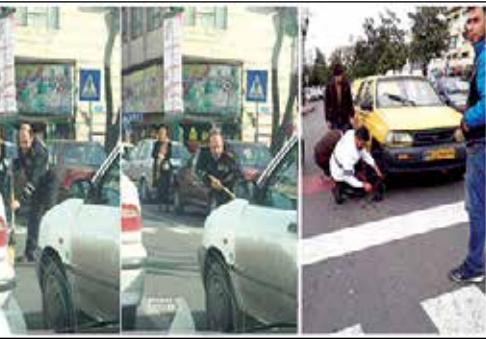
جارو کردن خرده‌شیشه‌های تصادف توسط پلیس