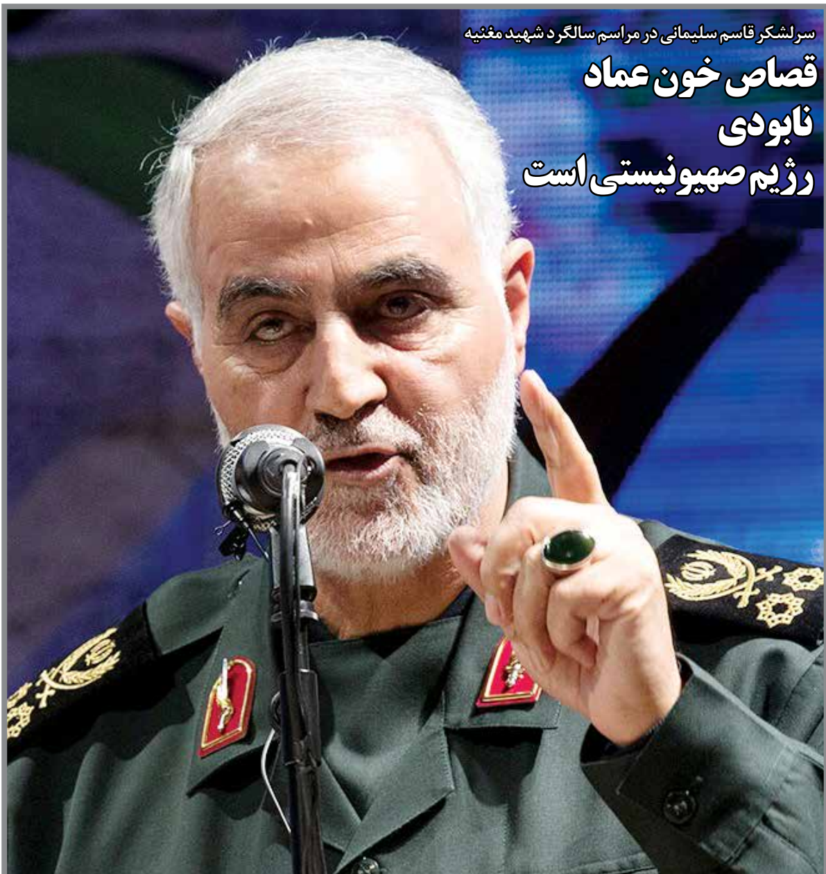
سرلشکر قاسم سلیمانی در مراسم سالگرد شهید مغنیه

در برابر حضور ده‌ها میلیون ایرانی غیرتمند در کف خیابان‌های ایران و اعلام موضع صریح در مقابل دشمن، حرف از رفراندوم زدن نه تدبیر است و نه حتی سلیقه!