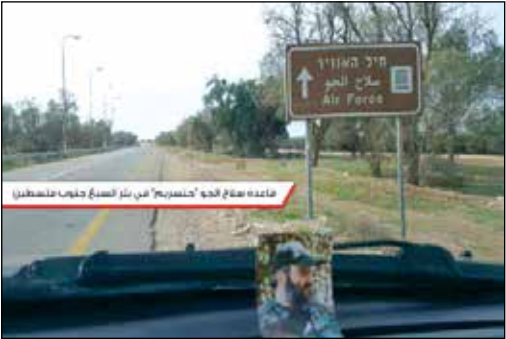
عکس شهید عماد مغنیه بیخ گوش صهیونیست‌ها