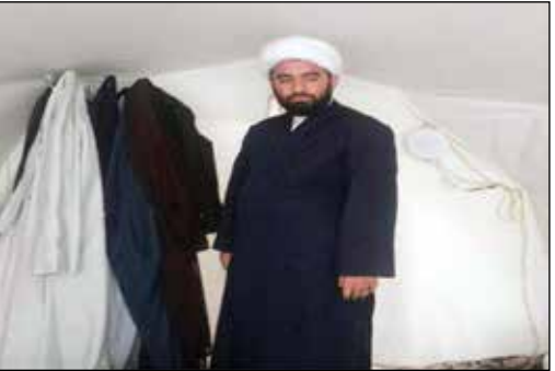
زندگی امام جمعه سرپل‌ذهاب در چادر برای همدردی با مردم