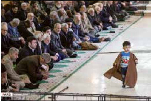
در حاشیه نماز جمعه تهران

۴- گفته می‌شود در جنگ سایبری ربات‌ها از انسان‌ها سریع‌تر و بهتر کار می‌کنند؛ اما نباید نقش عامل انسانی را در جنگ‌های سایبری دست کم گرفت؛ زیرا در آینده هر اندازه ماهیت فنی جنگ‌های سایبری پیچیده باشد باز نیروی انسانی از آن پیچیده‌تر است.