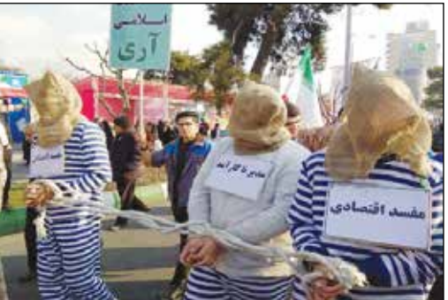
دستگیری نمادین مفسدان اقتصادی و مدیران ناکارآمد در راه‌پیمایی ۲۲ بهمن!