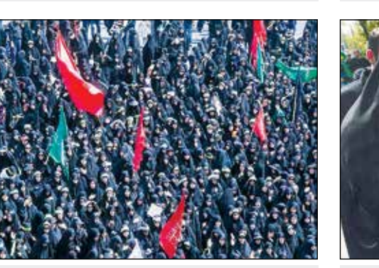
اینان زانانی هستند که چهره شهر را تغییر دادند

حجت‌الاسلام پنهان‌پیش از خطبه‌های نماز جمعه با اشاره به ارزش امید و نیاز آن در جامعه گفت: بدون امید مشکلات مضاعف دیده می‌شود و راه عبور از مشکلات دیده نمی‌شود. ابلیس یکی از کارهایی که انجام می‌دهد، وارد کردن یأس به افراد است. تمام اخبار این رسانه‌های حاوی یأس و تفرقه است. بی‌بی‌سی چند سال پیش در ایام تاسوعا در تحلیلی گفته بود، تاسوعا روز عزرا برای برادر تانمی امام حسین (ع) است، اینها اگر دست‌شان بیاید میان حضرت عباس(ع) و حسین(ع) هم نفاق ایجاد می‌کنند.