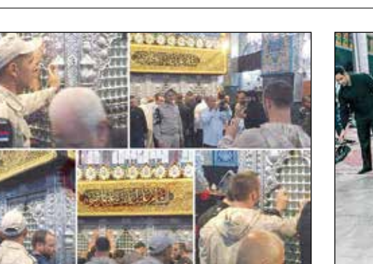
احترام سربازان روسی به ساحت مقدس حضرت زینب(س)