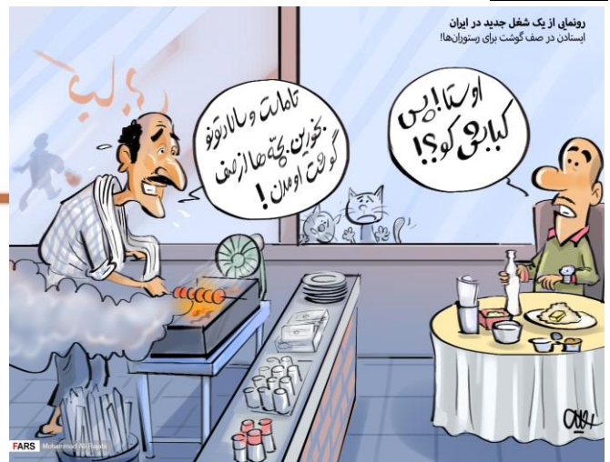
رونمای از یک شغل جدید در ایران ایستادن در صف گوشت برای رستورانها!