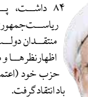
پی‌نوشت: ۱- محمدعلی الفتوری، بازگشت از نیمه راه.

۸۴ داشت، پس از انتخابات ریاست‌جمهوری نهم در صف منتقدان دولت قرار گرفت و در اظهارنظرها و مقاله‌ها در روزنامه حزب خود (اعتماد ملی) دولت را به باد انتقاد گرفت.