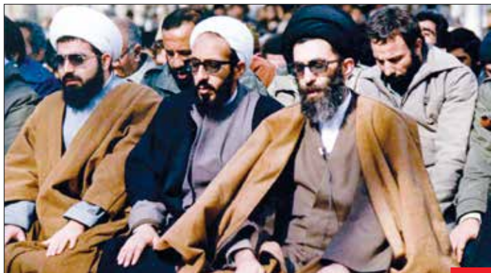
۴۰ سال پس از اولین نماز جمعه/ پس از انتصاب آیت‌الله خامنه‌ای به عنوان امام جمعه تهران از سوی امام خمینی (ره)، ایشان در ۲۸ دی ۱۳۵۸ نخستین خطبه‌های نماز جمعه خود را در دانشگاه تهران ایراد کردند. هفته گذشته رهبر معظم انقلاب پس از ۴۰ سال، در همان روز در نماز جمعه‌ای تاریخی خطبه‌هایی تاریخ‌ساز را ایراد کردند.