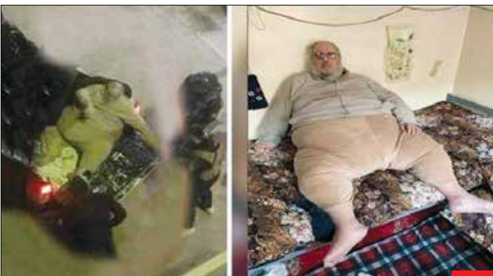
مفتی فریه داعشی/ نیروهای ضربت عراق یکی از مفتی‌های داعش را در موصل دستگیر کردند. وی به تکه تکه کردن، اعدام، برده‌داری، تجاوز، دزدیدن و فروش مسلمانان و غیر مسلمانان مخالف داعش متهم است. زمانی که نیروهای عراقی این داعشی را دستگیر کردند ماشین مناسبی برای حمل او پیدا نکردند و در نهایت مجبور شدند از خودروی وانت استفاده کنند!