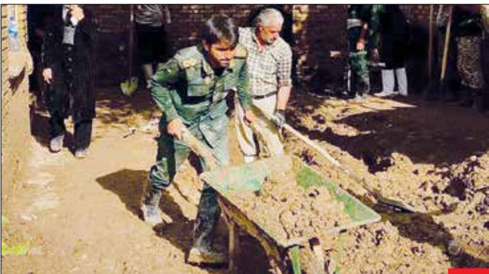
کمک‌رسانی نیروهای سپاه به مردم حادثه‌دید در سیل سیستان و بلوچستان/ از همان روزهای ابتدایی نیروهای سپاه و ارتش با تمام توان به کمک مردم محاصره در سیل شتافتند. علاوه بر این، مردم دیگر مناطق ایران با کمک‌های نقدی و غیر نقدی خود در کنار سبیل‌زدگان سیستان و بلوچستانی هستند.