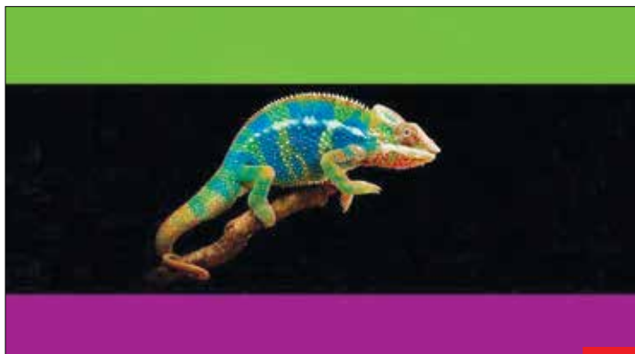
پرچم ملی آدم‌های منفعت‌طلب و هر روز به یک رنگ! یکی از هنرمندان با اشتراک‌گذاری این عکس نوشت: «نه سبز بودم، نه بنفش شدم، نه تکرار کردم و نه سیاه می‌شوم. ولی افسوس که هنوز هم بسیاری کسانی که دنیا‌رو سلب‌پرستی‌های آفتاب‌پرستی هستند که یک روز به فلان کاندید یا «اعتقاد راسخ» دارند، روز دیگر تظاهر به فریب‌خوردگی می‌کنند، یک روز تاریخ‌سازند و روز دیگر تاریخ‌باز.»