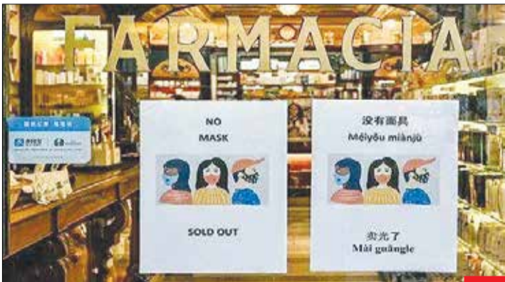
کرونا بیاد، همه جا حطی ماسک هم می‌آید! / اینجا ایتالیا، بعد از افزایش تعداد مبتلایان به کرونا در چند شهر این کشور، تمام داروخانه‌ها نوشته‌هایی مانند این تصویر را بر سر درشان چسباندند: ماسک نداریم! در کشورهای دیگر مانند ژاپن، بر سر ماسک دعوا و زد خورد هم شد. در آلمان نیز قیمت محلول‌های الکلی پنج برابر شد. دلال‌های سو، استفاده‌گر ملیت نمی‌شناسند!