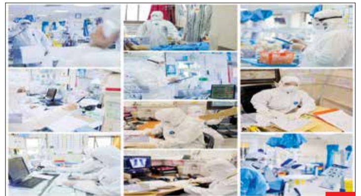
ساعت‌ها کار کردن با این لباس‌ها خیلی سخت است، این لباس‌ها آدم را خیس عرق و کلافه می‌کند، جای عینک و ماسک روی صورت رد عمیقی می‌اندازد، نمی‌شود راحت نماز خواند یا غذا خورد، همیشه هم استرسز ابتدا به بیماری کرونا می‌خورند... این روزها در جنگ بیولوژیک لباس رزم سربازان ایران سفید است... برای تک‌تک این سربازان دعا می‌کنیم که سالم و پیروز باشند.