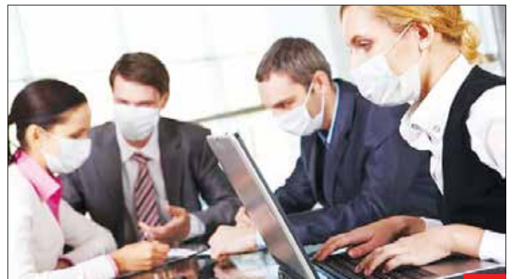
وقتی آمریکایی‌ها مجبور هستند هرطور شده کار کنند! / پیش‌بینی نشریه آمریکایی «هلتانین»: در آمریکا ۳۲ میلیون نفر امکان استفاده از مرخصی با حقوق را ندارند و روزمزد هستند و اگر یک روز کار نکنند، به مشکل می‌خورند. بسیاری حتی هنگام بیماری سر کار می‌روند و این موجب شیوع بیشتر کرونا خواهد شد. در سال ۲۰۰۹، هشت میلیون نفر با داشتن آفت‌انزای خوک سر کار رفتند و سبب ابتلای افراد بیشتری به این بیماری شدند.