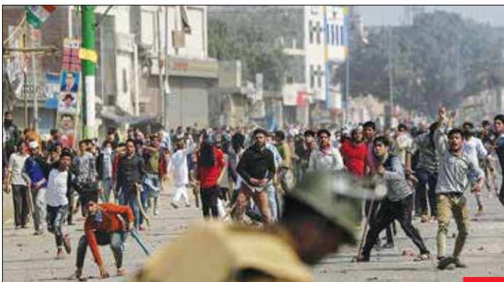
در پی اعتراض گسترده مسلمانان هندی به سفر ترامپ و تصویب قانون تبعیض مذهبی، یورش نظامیان هندی و هندوهای متعصب به مرگ حداقل ۴۲ نفر منجر شد. هندوهای متعصب با دست گرفتن سلاح سرد به خانه‌های مسلمانان و مساجد حمله کردند و تعدادی را کشتند. مسلمانان هندی به تصویب قانونی معتزض هستند که طبق آن غیر هندی‌ها به شرط مسلمان نبودن، می‌توانند تابعیت این کشور را دریافت کنند.