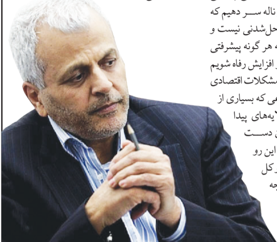
مشروح گفت و گو با دکتر دانش جعفری را در ssweekly.ir بخوانید.

وجود داشته باشد و چه محدودیتی در این زمینه نداشته باشیم، مهم ترین اولویت و اصلی ترین پیش نیاز کشور برای رشد و توسعه اقتصادی به شمار می رود.