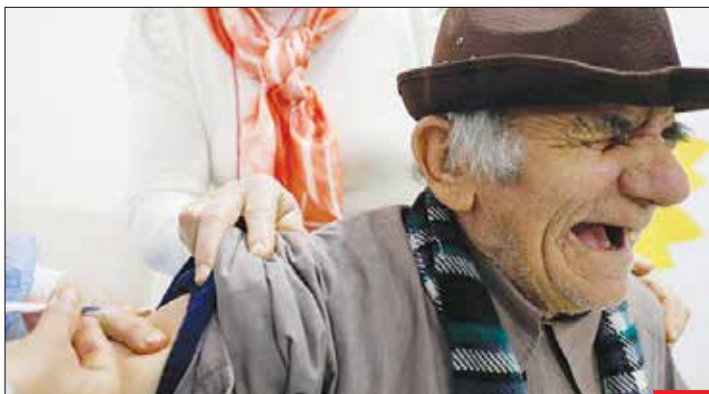
۱۴۰۰ بچون کرونا/ سال ۱۳۹۹ رو به اتمام است و این آخرین عکس قسمت عکس خبر در سال ۱۳۹۹ است. بیشتر عکس‌های امسال به کرونا و هشدارهای رعایت شیوه‌نامه‌های بهداشتی اختصاص داشت. کرونا هنوز کنار ما و منتظر غفلت است تا خدایی نکرده ضربه‌ای وارد کند. ان‌شا‌الله در سال جدید با کامل شدن واکسیناسیون و واکسن‌های ایرانی و رعایت بیشتر شیوه‌نامه‌ها، کرونا تمام شود. سال نو پیشاپیش مبارک