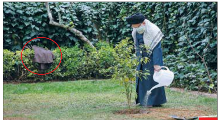
رهبر بی‌مانند/ به مناسبت روز درختکاری امام خامنه‌ای دو اصله نهال میوه کاشتنند. کاربران فضای مجازی با انتشار این عکس نوشتند: «هرچای دنیا رو ببینید؛ وقتی یک مقام، مسئول، حاکم، رهبر و کاره‌ای تو حکومت جایی می‌رود کاری انجام دهد، چندین خدم و حشم کنارش هستند تا هر کی خودی نشان دهد و... ولی کشورم رهبری دارد که حتی زحمت نگه داشتن عباي شخصی خودش را هم به کسی نمی‌دهد.»