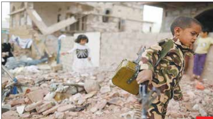
دفاع از وطن سن و سال ندارد/ این کودک یعنی فیمیده است که طعم شیرین پیروزی نصیب کسانی می‌شود که مقاومت و ایستادگی کنند، وگرنه در انتها خواری و ذلت است. یعنی‌هایی که خواب از سر سعه‌ودی‌ها برانده‌اند و دیگر نقطه‌ای در خاک عربستان و امارات وجود ندارد که از تیررس موشک و پهپادهای رژیم‌نگان یمن خارج باشد. به امید پیروزی حق علیه باطل.

مقام‌های اماراتی و اتحادیه عرب باید بدانند مالکیت ایران بر این جزایر بر اساس اسناد تاریخی و معتقد شده قطعی و غیر قابل مذاکره بوده و از نظر حقوقی هیچ ادعایی را در خصوص مالکیت بر جزایر سه‌گانه ایرانی نمی‌توانند داشته باشند. کشوری که خود به اندازه درختان چنار خیابان ولی عصر تهران قدمت ندارد، نمی‌تواند نسبت به سرزمینی که از هزاران سال پیش متعلق به ایران بوده، ادعای واهی را مطرح کند؛ مضاف بر اینکه گذشته است زمانی که به ثمن بخش خاک این کشور را پیشکش می‌کردند. جمهوری اسلامی ضمن اینکه در مواجهه با ادعاها هر چند واهی منطق گفت‌وگو برای رفع اختلاف و ابهام دارد، اما در مواجهه با طرف گستاخی که قصد طمع به سرزمینش را داشته باشد، در میدان عمل پاسخ سخت و در عین حال پشیمان‌کننده می‌دهد.