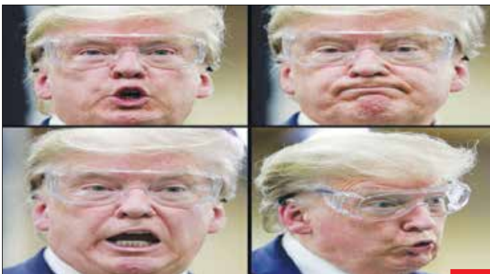
ترامپ دیوانه این هفته هنگام بازدید از کارخانه تولید ماسک حاضر به استفاده از ماسک نشد و فقط از عینک استفاده کرد! احتمالاً می‌ترسد کرونا فقط از چشم‌هایش وارد بشود! شاید هم به توصیه خودش مواد ضدعفونی‌کننده خورده و نگران مبتلا شدن به کرونا نیست!