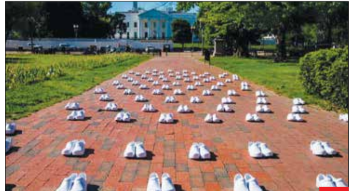
تصویری از اعتراض پرستان آمریکا مقابل کاخ سفید؛ آنها می‌گویند دولت فدرال و ایالتی به میزان کافی از پرستان حمایت نمی‌کند و وسایل کافی و لازم برای حفظ جان آنها را در اختیارشان نمی‌گذارد. پیش از این، کادر درمانی بیمارستان‌های آمریکا به برخورد بد شهروندان با آنها معترض بودند.