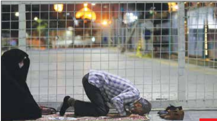
شب میلاد امام حسن مجتبی (ع) و درهای بسته بارگاه ملکوتی امام رضا (ع) بر زائرانش؛ همه ما دل‌تنگ زیارت‌نامه و معصومین (ع) هستیم، اما به تومیه ستاد ملی مبارزه با کرونا هم توجه می‌کنیم. ان‌شاءالله به زودی جشن پایان کرونا را در تمام مکان‌های مذهبی می‌گیریم.