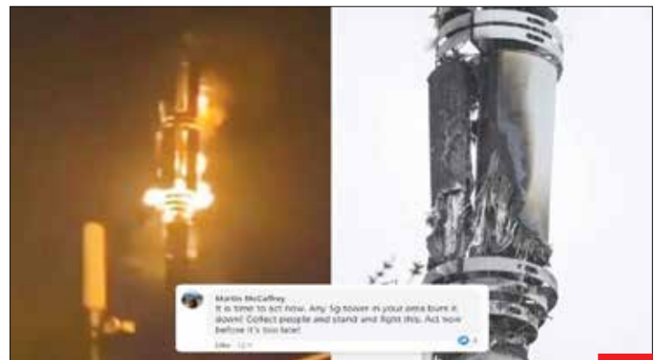
دکل‌های اینترنتی را نابود کنید تا کرونا متوقف شود! حرفی که شاید برای شما خنده‌دار باشد، اما انگلیسی‌ها آن را جدی گرفته‌اند. حدود ۸۰ درصد دکل‌های نسل پنجم در انگلستان به دست مردم نابود شده‌اند. فناوری نسل پنچ از بهترین فناوری‌های مخابراتی به حساب می‌آید که چین در آن پیشروست؛ شاید این در خشم انگلیسی‌ها برای نابودی این دکل‌ها بی‌تاثیر نباشد!