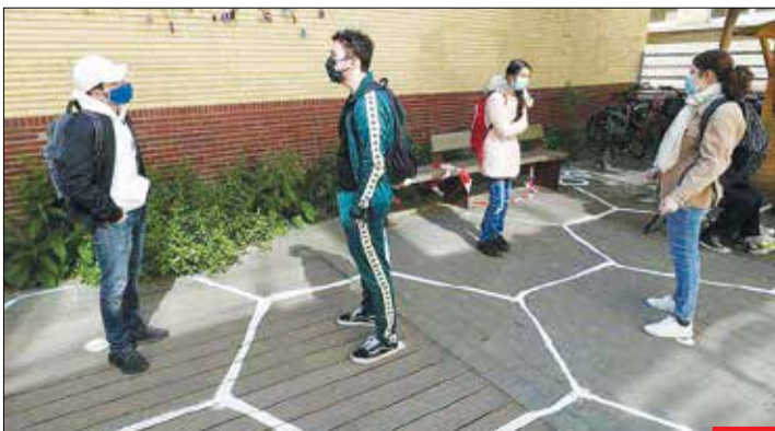
حفظ فاصله اجتماعی در رنگ تفریح/ با گذشت چند ماه از اوج گیری کرونا، اکنون زندگی با این ویروس برای مردم کشورهای مختلف در حال عادی شدن است. در بسیاری از کشورها، مانند ایران مدارس با رعایت نکات بهداشتی در حال بازگشایی هستند. فاصله اجتماعی در یکی از مدارس بلژیک را می بینید.