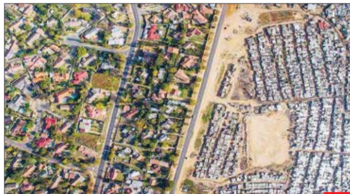
خط فقر به روایت تصویر/ تصویر هوایی تأثیرگذار از شهری در آمریکا که یک سوی آن بافت فقیرنشین با خانه های چندطبقه در مکانی خشک و در مقابل، محله های ثروتمندنشین با خانه های ویلایی و مناطق سرسبز قرار دارد. اینکه هر روز چند قدم آن طرف تر فقرا را ببینی و کاری کنی یا ثروتمندان را ببینی و افسوس بخوری، برای هر دو طرف سخت است.