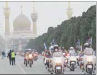
حضرت امام خاتمه‌ای (روحی فدا) است. وی در پایان گفت: «پیام ما آمادگی و حضور

گفتنی است، پس از سخنرانی سردار عبادی رژه باشکوه موتورسواران نیروهای مسلح رأس ساعت ۹/۳۳ صبح از محل دانشکده پرواز شروع شد و مسیر رژه از دانشکده پرواز تا حرم مطهر حضرت امام (ره) ادامه داشت که در میدان آزادی به موتورسواران حلقه کل اهدا شد و در ادامه با بالگرد میدان آزادی و مسیر رژه تا حرم مطهر گلباران شد.