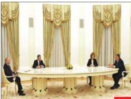
میزش هنوز ایراد دارد؛ در حالی که در سفر رئیس‌جمهور ریسی به روسیه، برخی ایراد بگیران به میز این دیدار هم رحم نکردند و توهماتی، مانند اینکه چرا اینقدر پوتین از ریسی دور نشسته است، این‌قلت وارد کردند، در جدیدترین دیدار پوتین با مقام اول یک کشور دیگر، باز هم پوتین با همان سر همان میز و با همان تدارکات نشست. برخی به دنیا آمده‌اند که فقط حس ناامیدی القا کنند!