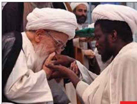
اسوه تواضع/ تصویری از آیت‌الله مافی کلیایگانی که در حال بوسه زدن بر دستا یک طلبه نوجوانی است و نشان از تواضع این عالم ربانی دارد. آیت‌الله العظمی مافی کلیایگانی از مراجع تقلید شیعه در پی ایست قلبی هفته پیش دار فانی را وداع گفت. این عالم بزرگوار از باران امام و رهبری بود و از جمله آثارشان سفرنامه حج، نیایش در عرفات، حدیث بیداری، شهید آگاه، پروزی از عظمت امام حسین (ع)، با عاشوراییان و... است.