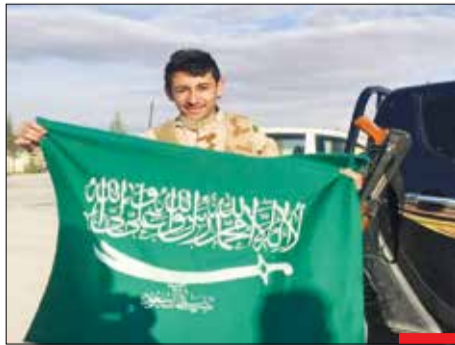
پرچم آینده عربستان/ این دلاور رزمنده یعنی با بر دست گرفتن این پرچم، آن را با عنوان پرچم آینده عربستان در شبکه‌های اجتماعی منتشر کرد. شدت حملات بر مردم یمن هفته‌هاست که افزایش یافته و با این حال نیروهای انصارالله هم بیگار ننشسته و حملات فلج‌کننده‌ای را به قلب متجاوزان دانشه‌اند. به امید اینکه مردم یمن به زودی طعم آرامش را چشند و مردم عربستان هم از زیر ستم حکومت خود رها شوند.