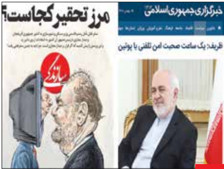
قبلاً تحقیر نبود، حالا شد؛ روزنامه سازندگی با اشاره به سفر وزیر راه به آذربایجان و دیدار وی‌دونوی رئیس‌جمهور ایران کشور با رستم قاسمی در آذربایجان، آن را تحقیر و تیدیافتن مقام ایرانی از سوی علی‌اف می‌داند، در حالی که علی‌اف به دلیل مشکوک شدن به کرونا دیدار حضوری با رستم قاسمی را به وی‌دونو کنفرانس تبدیل کرده بود. دوستان تحقیر شده، بد نبود افتخار تماس امن تلفنی طریف با پوتین در مسکو را به یاد می‌آوردند!