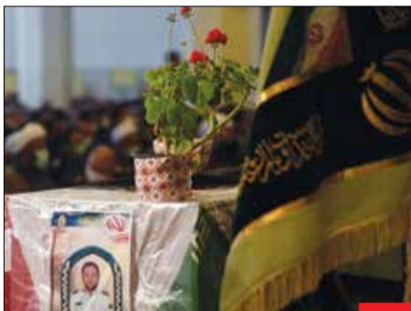
شهید مدافع وطن/ شهید سرهنگ دوم علی‌اکبر رنجبر از کارکنان شجاع و رشید ناجا که در جین دفاع از جان و مال مردم و حفظ آرامش در شهر به دست اراذل و اوباش به شهادت رسید. این شهید بارها در منطقه خود ضربه‌های سنگینی به مخان آرامش زده بود و در نهایت در همین راه و دفاع از آرامش وطن به شهادت رسید. قائل این شهید با تلاش نیروهای انتظامی در کمتر از یک روز شناسایی و دستگیر شد.