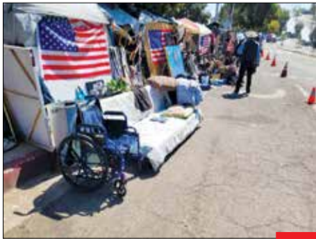
عاقبت مبین‌پرستی!؛ شهر چادری نام منطقه‌ای در غرب شهر لس‌آنجلس است که بی‌خانمان‌هایی که بیشتر آنها کهنه سربازان ارتش هستند، چادرهای خود را مقابل کلبه اداره کهنه سربازان ارتش برپا کرده‌اند. این سربازها که زمانی ال‌کوی مبین‌پرستی بوده‌اند، امروزه حتی در مبین خود سقفی بالای سر ندارند و به طور کامل فراموش شده‌اند. ذات دولت‌های غربی همین است، تا وقتی سود برسانی، هوایت را دارند!