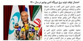
احتمال توقف تولید برق نیروگاه اتمی بوشهر در سال ۱۴۰۰ معاون سازمان انرژی اتمی گفت: به دلیل شرایط جاری بر اثرات بین‌المللی کشور و مشکلات ناشی از انتقال ارز و تحریم‌های بانکی و مشکلات در زمینه تامین و انتقال ارز برای تامین برش ضروریات واحد یکم نیروگاه اتمی بوشهر مواجه هستیم و چنانچه همکاری برای حل این مشکل صورت نگیرد، برق این واحد در سال جاری با مشکلات جدی مواجه شده و مأموران هم آن می‌روند که فعالیت آن متوقف شود.

از شهریور ۱۳۸۷ یعنی حدود ۱۸ سال است برای انرژی هسته‌ای که یکی از مهمترین دلایل آن تولید برق کشور است، هزینه می‌دهیم. میزان برق مصرفی کشور حدود ۵۰ هزار مگاوات میزان تولید نیروگاه بوشهر: کمتر از ۱۰۰۰ مگاوات پس از ۱۸ سال 🇮🇷