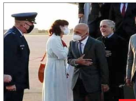
استقبال موتوری! در شرایط حساس افغانستان، مقامات دولتی این کشور به آمریکا می‌روند و هیچ مقامی برای استقبال‌شان به فرودگاه نمی‌آید! از این رو سفارت افغانستان برای تشریفات مسئولان کشورش از یک شرکت خصوصی دعوت می‌کند و مقامات افغانستان به خیال اینکه ژنرالی آمریکایی به استقبال آنها آمده است، به رییس تشریفات سلام می‌دهند!