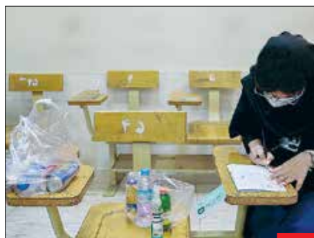
سه ساعت امتحانه دیگه! هفته پیش امتحان سراسری کنکور در کشور برگزار شد و پس از کش و قوس‌های فراوان بالاخره دانش‌آموزان به این مارتن علمی تن دادند. حجم تنقالاتی که برخی شرکت‌کنندگان سر جلسه آورده بودند، به حدی بود که خوردن آنها اندازه زمان پاسخ به یک درس تخصصی وقت می‌گرفت!