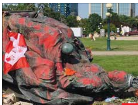
افتضاحی دیگر برای مدعیان دموکراسی، در پی کشف سه گور جمعی کودکان بومی کانادایی، معترضان خشمگین همزمان با روز ملی کانادا، مجسمه ملکه ویکتوریا و ملکه الیزابت را سرنگون کردند. کانادا کشوری پادشاهی است و ملکه انگلیس، ملکه کانادا هم به شمار می‌آید.