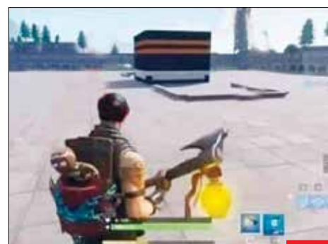
توهین به مقدسات مسلمانان، در نسخه جدید بازی آمریکایی فورت‌نایت، بازیکنان برای کسب امتیاز باید کعبه، قبله‌گاه مسلمانان را تخریب کنند! کافران دشمنی با اسلام را آشکار و بدون نقاب کرده‌اند و متأسفانه برخی حکومت‌های عربی در خواب خوش به سر می‌برند.