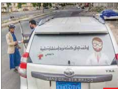
هر لحظه به فکر مردم، دکتري وقیفه‌شناس در یمن که پشت ماشینیش نوشته‌اگه مشاوره پزشکی لازم داشتید بهم بگین توقف کنم. مردم یمن چند سال است که درگیر جنگی نابرابر هستند و در محاصره به سر می‌برند و مردم این کشور با محدودیت خدمات و تجهیزات پزشکی مواجه‌اند.