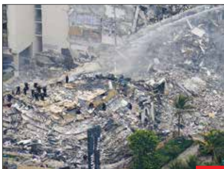
کسی فریاد شهردار استعفا سر نمی‌دهد! یک آپارتمان ۱۲ طبقه در فلوریدای آمریکا فرومی‌ریزد و حداقل ۲۰ قربانی و ۱۶۰ مفقودی به جای می‌گذارد. پس از چندین روز هنوز آواربرداری ادامه دارد و به کشته‌ها اضافه می‌شود، اما کسی نیروهای امدادی و مدبریتی را حین انجام کار با شعارهای استعفا و... دلسرد نمی‌کند.