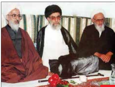
همراه همیشگی ولی فقیه، آیت الله حسن زاده آملی و آیت الله جوادی آملی در کنار امام خامنه ای

«انسان در عرف عرفان» عنوان رساله ای درباره موضوع انسان از دیدگاه قرآن کریم و معارف الهی است که ستاد آیت الله حسن زاده آملی در چهار فصل با عناوین «در تعریف انسان، مراد از عرفان در موضوع رساله، تمثالات و القانات سبوحی و اصول ایقانی» تدوین کرده است. ایشان این اثر را، مانند سایر آثار عالمانه خویش، ساده و در خور همگان به رشته تحریر در آورده است.