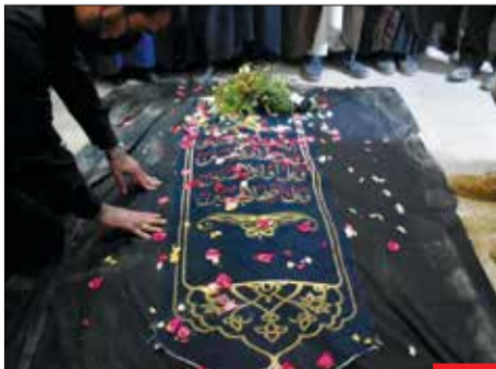
قاب آخر! استاد علامه حسن زاده آملی پس از تحمل یک دوره بیماری سرانجام در ۹۳ سالگی دعوت حق را لبیک گفت.