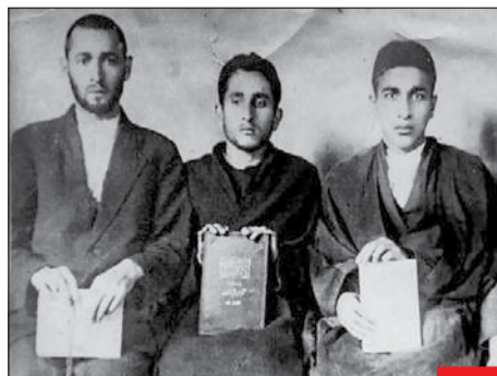
تصویری قدیمی از استاد حسن زاده آملی در دوران طلبگی/ علامه نذر اول از چپ