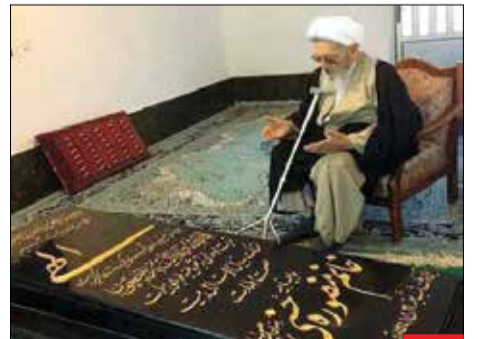
بیت الرحمه! علامه در کنار مزار همسرش در خانه خود که نام این اتاق را «بیت الرحمه» نامیده بود.