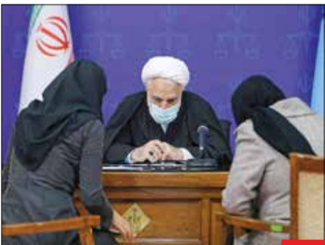
گوش شنوا، در سلسله برنامه‌های ملاقات مردمی رئیس قوه قضائیه که به مدت دو ساعت با تعدادی از خانواده‌های محکومان امنیتی حوادث آبان ۹۸ و جرایم عمومی برگزار شد، محسنی‌آزهی، عالی‌ترین مقام قضایی کشور این گونه به حرف مردم و مراجعه‌کنندگان گوش می‌کند. گوش شنوایی که همه مسئولان و خدمتگزاران مردم باید داشته باشند و مستقیم حرف‌های مردم را بشنوند.