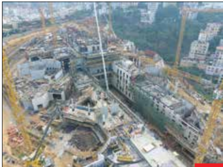
لانه جاسوسی، لیبانی‌ها با هشتک وکر عوکر مار قلعه (لانه جاسوسی آمریکا قلعه شد). نسبت به ساخت پایگاه بزرگ آمریکا که در آن یک سفارتی هم جاسازی شده، اعتراض کردند و پرسیدند «چرا بزرگترین پایگاه آمریکا پس از بغداد، در کشور کوچکی مثل لبنان با مبلغ هفتک یک میلیارد و ۴۰۰ میلیون دلار ساخته می‌شود؟» باید دید با توجه به سوابق سیاهی که آمریکایی‌ها در کارکرد سفارت‌های‌شان دارند، چگونه اجازه ساخت چنین بنايي از سوی دولت لبنان داده شده است!