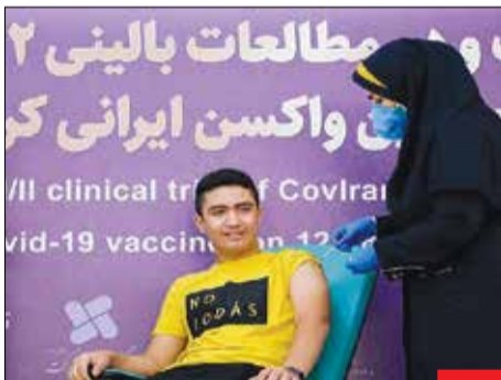
برکت در مسیر واکسیناسیون همگانی، واکسن کووید برکت با دریافت مجوز از سازمان غذا و دارو، فازهای یک و دو مطالعاتی بر روی ۱۲ تا ۱۸ ساله‌ها را آغاز کرد. هم‌زمان با آغاز فعالیت مدارس، سینماها و ... و فرودکش کردن شیوع بیماری کرونا، به لطف واکسیناسیون همگانی، شرایط کشور در وضعیت با ثباتی قرار گرفته است که البته با مشاهده گونه‌های جدید کرونا و افزایش بیماران در اروپا، باید فکر پایان محدودیت‌ها را فعلاً به تعویق بیندازیم.