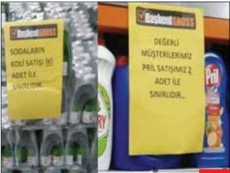
مرگ تدریجی یک رویا، اردوغان که روزگاری خود را بهترین حاکم منطقه می‌دانست و ادعا می‌کرد بدون اجازه او، در هیچ جایی سنگی نکان نمی‌خورد، توان کنترل مایع ظرف‌شویی را هم از دست داده است و در سایه نوسانات اقتصادی در هفته‌های گذشته در ترکیه، دلستر، مایع ظرف‌شویی و ... سهمیه‌بندی شده به فروش می‌رسند! بهتر است کشورت را سفت چسبی تا همین مرزهای فعلی را هم از دست ندهی، به جای آنکه دنبال خواب و خیال باشی!