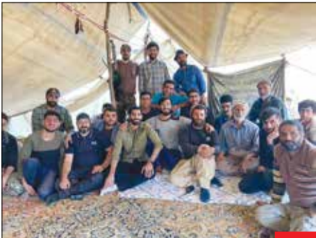
سلب‌برینی متدین الگو، محمد انصاری، ملی‌پوش و بازیکن سابق تیم فوتبال پرسپولیس، طلب ۲/۵ میلیاردی خود را به خیریه اهدا کرد و برای کاری خیر از پول خود گذشت؛ اما این تنها کار زیبایی او در هفته‌های گذشته نبود، این الگوی ورزشی با حضور در میان نیروهای جهادی که برای کمک به زلزله‌زدگان اندکی رفته بودند، دو روزی را در میان آنها مشغول خدمت به مردم بوده است. سلب‌برینی متدینی که می‌تواند الگوی نوجوانان باشد.