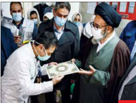
۶۰ عمل جراحی رایگان، به مناسبت سالروز تشکیل بسیج و با همکاری کمیته اسداد امام خمینی(ره) و بسیج جامعه پزشکی بیمارستان علوی تبریز ۶۰ بیمار مصروع مبتلا به آب مروارید چشمی را به صورت رایگان عمل جراحی کردند. امام جمعه تبریز، جنت‌الاسلام والمسلمین سیدمحمدعلی آل‌هاشم با حضور در بیمارستان علوی تبریز از تیم پزشکی این عمل‌ها و جامعه پزشکی بیمارستان علوی تبریز تقدیر و تشکر کرد.