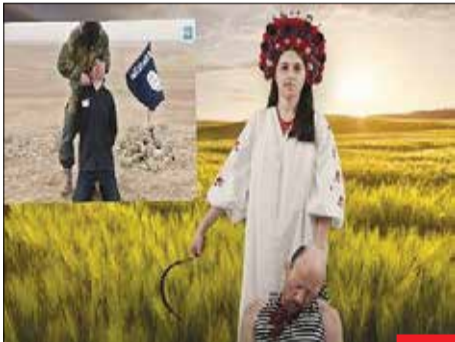
داعشیان تمدن! این زن اوکراینی با گردن زدن سر بر روسی به روش داعشی‌ها، روس‌ها را تهدید می‌کند. مدتی قبل این خوی وحشیانه از سوی همین اروپایی‌ها نگوشت می‌شد! اگه بلوند و چشم رنگی باشی، تو این دنیا هر غلطی می‌تونی بکنی!