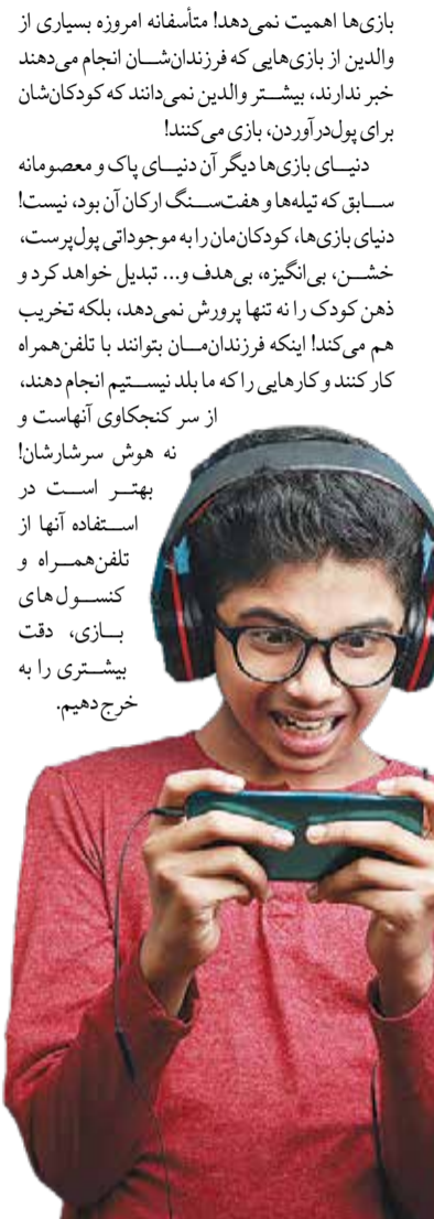
نه هوش سرشارشان! بهترین استفاده از تلفن همراه و کنسول‌های بازی، دقت بیشتری را به خرج دهیم.

با استفاده از بازی‌ها کسب درآمد کرد! در این سبک جدید از بازی‌ها که در حال فراگیر شدن هستند، بازی‌ها مبتنی بر بلاک‌چین و رمزارزها، NFT و... هستند. تمام این مفاهیم را در شماره‌های گذشته توضیح داده‌ایم. در این سبک از بازی‌ها، کاربران می‌توانند درآمد داشته باشند و رمزارزهای به دست‌آمده را در صرافی نقد کرده و به پول رایج کشورشان تبدیل کنند. فرض کنید که در یک بازی شما با خرید یک حیوان خانگی به صورت NFT، آن را پرورش می‌دهید، بزرگ می‌کنید و وقت صرف آن کرده و در نهایت بعد یک مدت، با مبلغی بالاتر آن را به مشتری جدیدش می‌فروشید! شاید تعجب کنید که برخی از این حیوانات خانگی تا ۱۰۰ هزار دلار هم فروخته می‌شوند! بازی‌های مبتنی بر رمزارزها روز به روز بیشتر می‌شوند، آگسی اینفینی، تان آرنسا و... از جمله بازی‌هایی هستند که صرفاً با بازی کردن و گذراندن مراحل، می‌توانید رمزارزهای مختص به آن بازی را به دست آورده و آنها را به پول تبدیل کنید. اینکه فرزند ۱۰ ساله شما با بازی کردن و به دور از چشم شما، درآمد هنگفتی داشته باشد، در آن سن کم، خطرهای بسیاری را برایش خواهد داشت. جدا از نحوه خرج کردن آن پول‌ها در دنیای واقعی که باید از سوی والدین حتماً بر روی آن نظارت باشد، وسوسه کردن کودکان به بازی کردن و کسب درآمد، بسیار ناعادلانه است! این شکل جدیدی از کودکاآزای و کودکان کار است که اگر کودکی را سر یک چهارراه در حین فروش دست‌مگلب بینیم، برایش ناراحت می‌شویم، اما فرزندان ما که در حال بازی برای کسب درآمد هستند، مصداق کودکان کار دنیای صفر و یک امروز هستند و کسی به این جنبه از