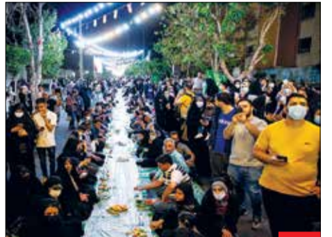
رمان و سفره نعمت‌هاش! به مناسبت ولادت امام حسن مجتبی (ع) در یکی از محله‌های تهران، مردم میمان سفره ۱۰۰۰ متره سحری بودند و در حالشیه آن مراسم جشن ولادت امام حسن (ع) را برگزار کردند. از این سفره‌ها در این ماه هر افطار و سحر در یک گوشه شهرمان می‌بینیم.