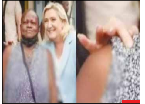
نکته جهان‌سومی و سپاه‌پوست بشی! مارین لوین، رقیب مکرون در انتخابات فرانسه، این چنین با اکراه و چند دستش رو روی‌شانه این فرد سپاه‌پوست گذاشته که انگار سپاهیش مسری هست! این آدم‌های عقب‌مانده برای ما ژست حقوق بشر می‌گیرند!