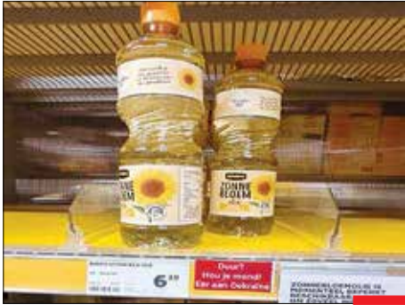
گروه؟ همین‌که هست! در حالی که روغن مایع تا چند وقت پیش زیر یک یورو بود، با اتفاقات اخیر در اروپا، این محصول در هلند به بالای ۶ یورو رسیده است؛ در جواب اعتراضات مردمی هم صاحب مغازه نوشته: گروه؟ حرف مفت زن! زنده باد اوکراین!