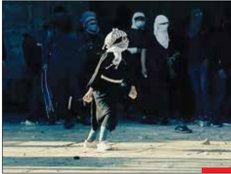
چرا خشونت رواج می‌دین! در حالی که زنان اروپایی به قهرمانان دنیای وحشی غرب تبدیل شده‌اند، این بانوی محبیه فلسطینی که این چنین غیرتمدانه در دفاع از سرزمین خودش دست به سنگ شده است، در رسانه‌های غرب ترویج‌دهنده خشونت قلمداد می‌شود!