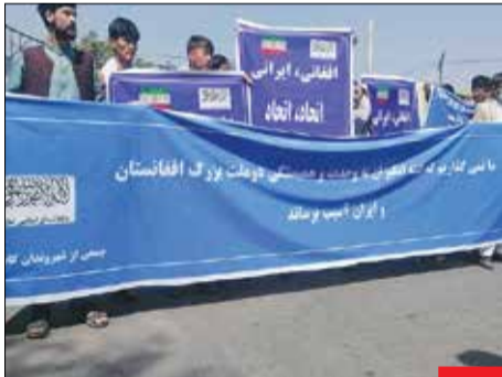
پاسخ به توطئه! در حالی که عده‌ای معلوم‌الحال تلاش کردند با تعرض به کنسولگری ایران در افغانستان، بین دو ملت ایران و افغانستان فتنه به پا کنند، مردم این کشور با برپایی جمعیت حمایت خود را از برادری همیشه‌گی دو ملت اعلام کردند.