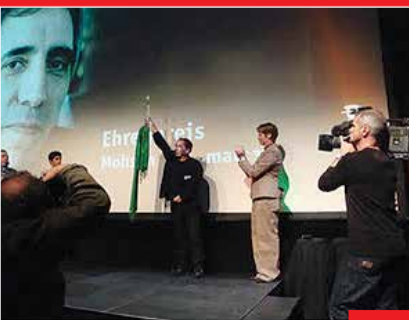
مخملباف و تقدیم «جایزه چشم‌انداز» جشنواره نورنبرگ به کروی