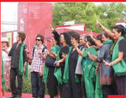
حاشیه‌سازی ضدانقلاب در جشنواره فیلم ونیز