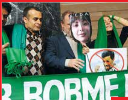
حتا مخملباف و بهمن قبادی در جشنواره فیلم سن‌سپاستین