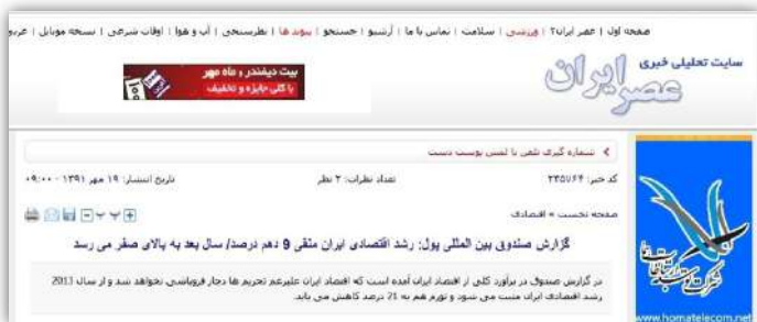
▲ ۱- وجه منفی: کاهش رشد اقتصادی در سال ۲۰۱۲