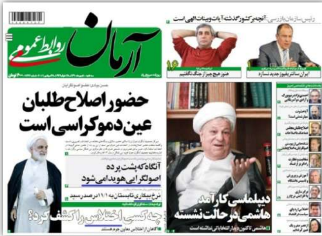
▲ «پشت پرده ای هویدا می شود» ← «بیکاری» ← «اختلاس»