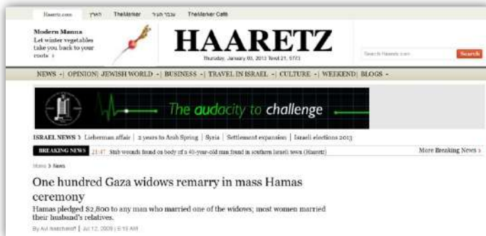
▲ خلاف جو سازی برخی رسانه‌های معاند، روزنامه‌ی اسرائیلی هاآرتص انعکاس درستی از واقعه داشته - ترجمه: «آزدواج مجدد یکصد زن بیوه در مراسم دسته جمعی حماس».