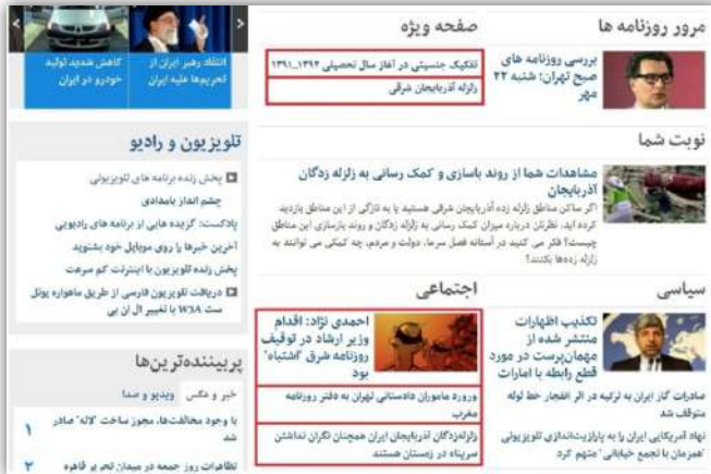
▲ در سایت بی بی سی فارسی خبر «تفکیک جنسیتی»، «توقیف روزنامه‌ی شرق»، «ورود مأموران دادستانی به دفتر روزنامه‌ی مغرب» در کنار اخبار زلزله‌ی شهرستان اهر و ورزقان آن هم با تعبیر «آذربایجان» آورده شده تا القایی باشد بر بی تفاوتی مسئولان نسبت به زندگی مردم ایران و خصوصاً آذربایجان.