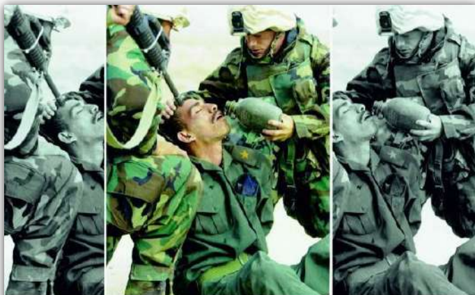
How the Media can manipulate our viewpoint

▲ مفهوم ظاهری عکس و متن: اخبار گزینشی، اذهان را منحرف می‌کند؛ پیام و مفهوم نهفته در عکس و متن: فارغ از برداشت‌های «افراط و تفریط» گونه، حقیقت آن است که آمریکا در طول جنگ، رفتاری انسان دوستانه با نظامیان عراقی و به طریق اولی با غیر نظامیان داشته است.