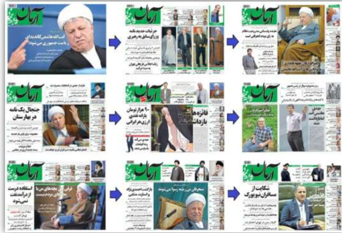
▲ اصل ۲: صفحه‌ی اول روزنامه‌ی آرمان روابط عمومی ۱

۱ «آیت الله هاشمی کاندیدای ریاست جمهوری می‌شود؟» ← «گفت و گو با آیت الله هاشمی: نباید در جامعه سوء ظن باشد» ← «اعتراف ارگان جبهه پایداری به توانایی‌های آیت الله هاشمی» ← «آیت الله هاشمی خطاب به صهیونیست‌ها: انتحار نظامی نکنید، صبر ایران لبریز خواهد شد» ← «فائزه هاشمی بازداشت شد» ← «مهدی هاشمی آمد اما بازداشت نشد» ← «واکنش آیت الله هاشمی رفسنجانی به بازداشت مهدی و فائزه فرقی بین بچه‌های من با بچه‌های مردم نیست» ← «آیت الله هاشمی رفسنجانی: منحرفان بی‌ریشه رسوا می‌شوند» ← «برادر وزیر ارشاد: حضور هاشمی در انتخابات منشأ خیر است».