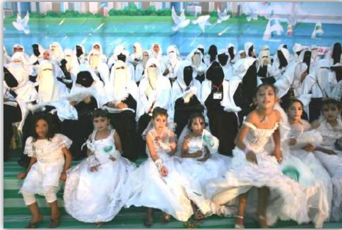
▲ کودکان غزه در جشن عروسی مادران خود