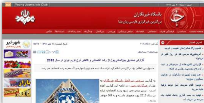
▲ ۱- وجه مثبت: کاهش نرخ تورم و افزایش رشد اقتصادی در سال ۲۰۱۳