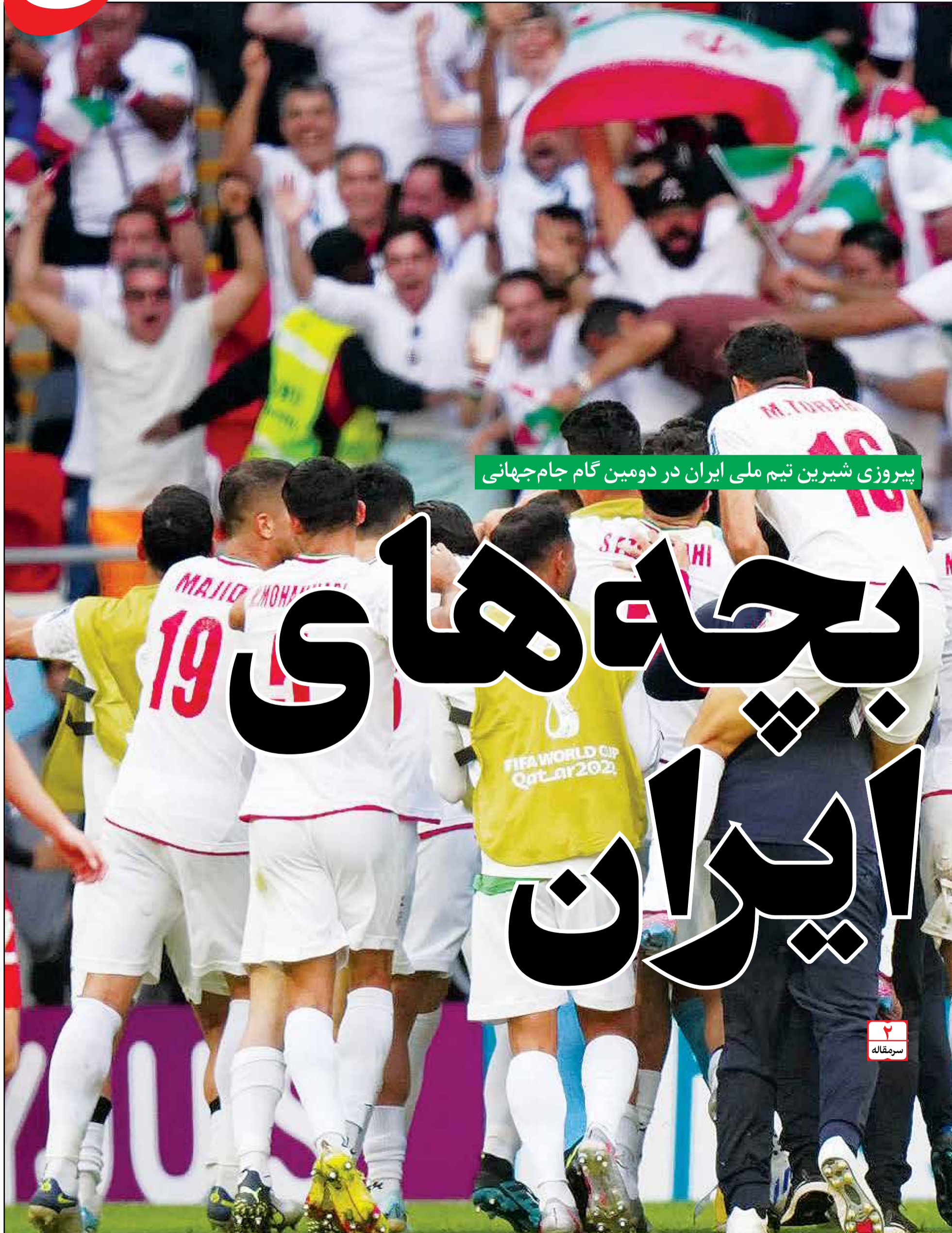
پیروزی شیرین تیم ملی ایران در دومین گام جام جهانی