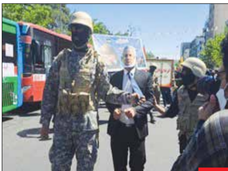
فردای پیروزی/ نتانیاهو، نخست‌وزیر رژیم جعلی و رو بہ زوال رژیم صہیونیستی در حاشیہ راهپیمایی روز قدس بہ شکل نمادین دستگیر شد. عاقبت کودک‌کشی چنین است.