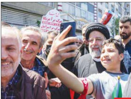
سلفی با آقای رئیس‌جمهور! / عکس سلفی یک نوجوان دہہ ہشتادی با سیدابراہیم رئیسی، رئیس‌جمهور در حاشیہ راهپیمایی روز جهانی قدس با زبات‌های بسیاری داشت.