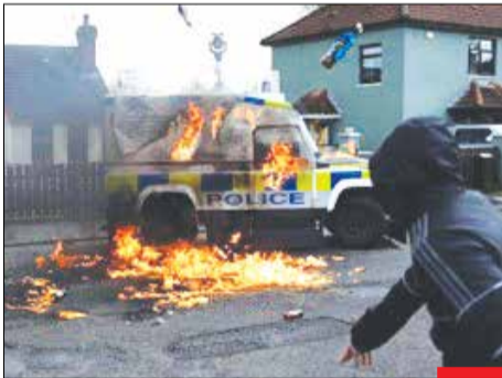
جایی برای بایدن نیست! / مردم معترض بہ سیاست‌های آمریکا با حضور در خیابان‌های ایرلند شمالی یک روز پیش از سفر بایدن، رئیس‌جمهور آمریکا بہ پلیس حمله کردند.