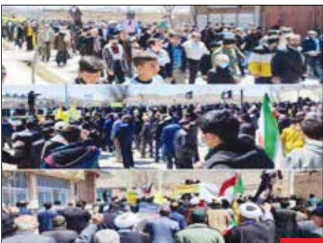
کابوس ہمیشگی براندازها/ راهپیمایی روز قدس بعد از شب‌های قدر و شب زندہ‌داری مردم روزہ‌دار، باز ہم پرشور و حرارت بود، حتی در شہرہایی کہ حدود ہزار نفر جمعیت داشتند.