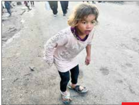
دمپایی‌های که حرف‌ها دارند.../ وضعیت این روزهای غزه بحرانی است، دمپایی‌های این دخترک خود گویای این روزهای وضعیت غزه است، البته اگر بتوانیم آنها را دمپایی بنامیم. ...