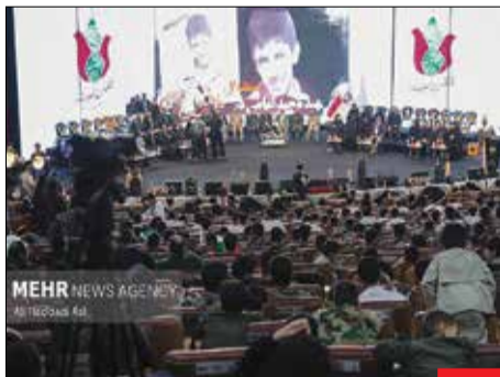
۲۴ هزار شهید در تهران/ کنگره ملی ۲۴ هزار شهید پایتخت با حضور «سردار حسن حسن‌زاده» فرمانده سپاه محمد رسول‌الله (ص)، «علیرضا فخاری» استنادار تهران و خانواده معظم شهیدا در سالن همایش‌های برج میلاد برگزار شد.