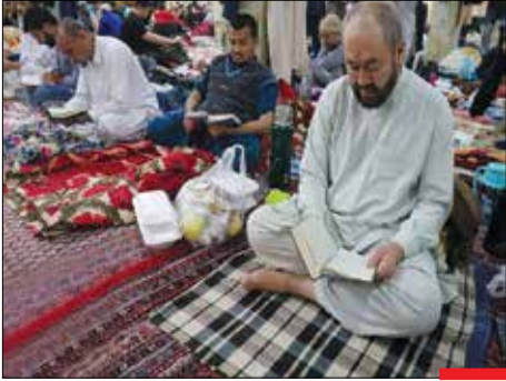
پایان ایام اعتکاف/ تعدادی از طلاب غیر ایرانی جامعه المصطفی العالمیه در مسجد امام حسن عسکری (ع) قم در مراسم معنوی اعتکاف شرکت کردند. اعتکاف امسال هم تمام شد و مشتاقان از آن بهره‌ها بردند.