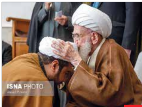
مراسم عمامه‌گذاری/ همزمان با ۱۳ رجب، مراسم جشن میلاد امیرالمؤمنین (ع) و عمامه‌گذاری تعدادی از طلاب حوزه علمیه در بیوت مراجع عظام تقلید آیات مکارم‌شیرازی، جوادی‌آملی و نوری‌همدانی برگزار شد.