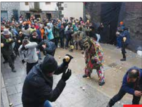
حمله به شیطان/ ژانویه هر سال در روز سن سیاستین، خیابان‌های شهر بیورنال اسپانیا مملو از جمعیتی است که قصد دارند با پرتاب شلغم، جارامپلاس را تنبیه کنند. «جارامپلاس» نماد شیطان است.