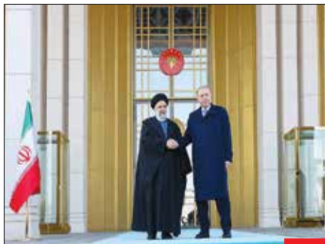
سفر به کشور همسایه/ «رجب طیب اردوغان» رئیس‌جمهور ترکیه از سیدابراهیم رئیسی، رئیس‌جمهور کشورمان در آنکارا به صورت رسمی استقبال کرد. ترکیه، شریک اقتصادی مهم جمهوری اسلامی ایران به‌شمار می‌آید.