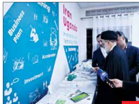
یک سفر فشرده / سیدابراهیم رئیسی، رئیس‌جمهور هفته اخیر سفری سه روزه به قاره آفریقا و سه کشور کنیا، اوگاندا و زیمبابوه داشت که در حاشیه سفرش به اوگاندا، دفتر تاورنی و فناوری ایران را در آنجا افتتاح و از این دفتر بازدید کرد.