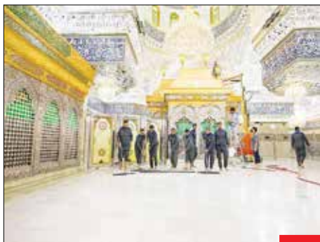
مردای محرم می‌آید / حرم امام حسین (ع) شست‌وشو شد تا برای عزاداری محرم و تشریف میلیون‌ها زائر آماده شود. خادمان این آستان، پس از بستن درهای ورودی به صریح، فرش‌های اطراف را جمع‌آوری کرده و اقدام به شست‌وشوی کف و دیوارهای اطراف صریح کردند.