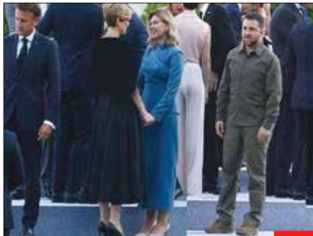
چو نخته باره، رها رها رها... / ششست هفته پیش دوستان ناتو اوکراین در ویلنیوس لیتوانی، بیش از هر موقع دیگری این جمله زلنسکی را که گفته بود: «ما را برای دفاع از کشورمان تنها گذاشته‌اند» برای خودش ثابت کرد! دوستان اوکراین کم‌کم سر حراج اوکراین مسابقه خواهند گذاشت...»