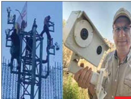
فضولی موقوف! / گروهی از جوانان لبنانی در مقابل دیدگان نیروهای ارتش رژیم صهیونیستی، دوربین‌هایی را که ارتش این رژیم در مرز لبنان نصب کرده بود، از جا کندهند. صهیونیست‌ها با نصب دوربین در مرزها از آمد و شد لبنانی‌ها جاسوسی می‌کردند.