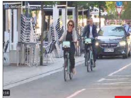
مادر ریا و نفاق! / «ترزا ریبرا» وزیر محیط زیست اسپانیا چند قدم مانده به اجلاس آب و هوا از لیموزین خود پیاده شد و بقیه مسیر را برای خودنمایی با دوچرخه طی کرد! او همچنین برای رسیدن به محل اجلاس با جت شخصی خود سفر کرده بود.