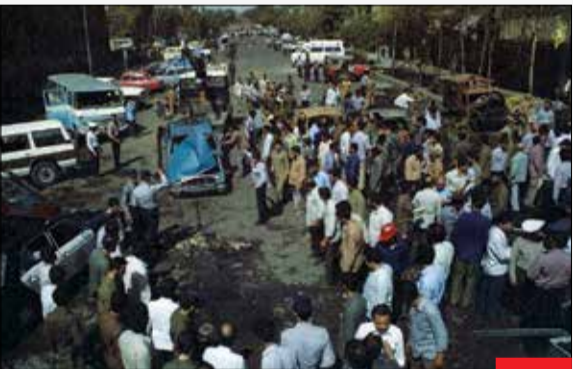
یکم شهریور ۱۳۶۳/ گروهک منافقین با انفجار بمبی عظیم در میدان راه آهن تهران سبب کشته و مجروح شدن صدها نفر از هم‌میهنان‌مان شدند. شدت این انفجار به حدی بود که شیشه‌های ساختمان‌های اطراف، تا شعاع ۱۰۰ متری شکسته شدند. خوی وحشیانه منافقین گریبان مردم عادی را همیشه گرفته است.