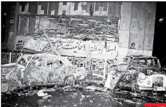
نهم مهر ۱۳۶۱/ در اقدامی تروریستی، گروهک منافقین بمب بسیار قوی را در میدان امام خمینی، ابتدای خیابان ناصر خسرو تهران منفجر کردند. بر اثر این انفجار، چندین ساختمان و مغازه تخریب، بیش از ۶۰ نفر شهید و حدود ۸۰۰ نفر مجروح شدند. این گروه کوردل عملیات‌های خود را در مراکز شلوغ انجام می‌داد.