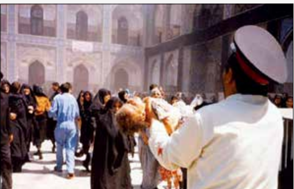
۳۰ خرداد ۱۳۷۳/ کوردلان منافق مصادف با روز عاشورا بمبی را در حرم امام رضا (ع) منفجر کردند که به شهادت ۲۷ نفر و مجروحیت ده‌ها نفر دیگر منجر شد. با همکاری مردم مؤمن مشهد، عامل اصلی و عوامل پشت صحنه این اقدام مذبوحانه تروریستی در فاصله چند روز پس از آن شناسایی و دستگیر شده با به هلاکت رسیدند.