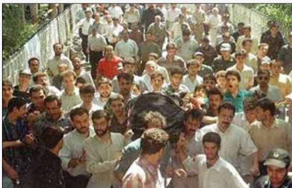
یکم شهریور ۱۳۷۷/ شهید اسدالله لاجوردی پس از خاتمه پرونده فرقان و پیشگیری از ادامه ترورها به دست این گروهک، مسئولیت دادستانی انقلاب تهران را در طول سال‌های ۱۳۶۰ تا ۱۳۶۳ برعهده گرفت. منافقین بارها کمر به ترور او بستند و در حالی او را ترور کردند که در بازار تهران به شغل تولید و فروشندگی روسری مشغول بود و هیچ گونه حفاظتی از او نمی‌شد.