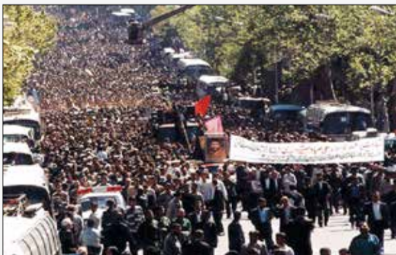
۲۱ فروردین ۱۳۷۸/ نمایی از مراسم پرشکوه تشییع پیکر شهید علی صیادشیرازی؛ شهید سبهد علی صیادشیرازی در سازماندهی نیروهای انقلابی ارتش نقش بسزایی داشت و پس از پیروزی انقلاب، در بحبوحه غائله سال ۱۳۵۸ ضدانقلاب در کردستان، به فرماندهی عملیات شمال غرب کشور برگزیده شد و از همانجا منافقین کینه او را به دل گرفتند.