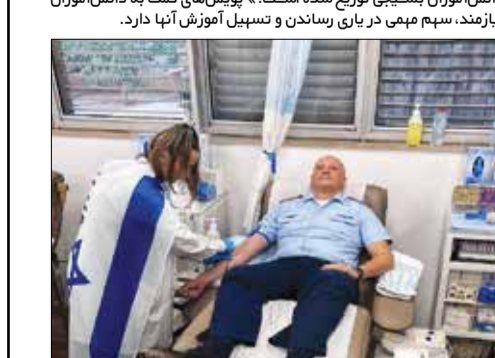
چه زیست زشتی! فرمانده نیروی هوایی آلمان در حمایت از نظامیان آواره صهیونیستی که کودکان و زنان غزه را قتل عام می‌کنند، خون اهدا کرد. اروپایی‌ها حتی در ظاهر هم زیست انسان نمی‌توانند بگیرند و حیوانیت خود را بروز می‌دهند!