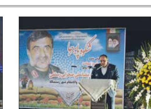
یاد یاران، مراسم سومین سالروز شهادت سردار رضا نعلی صحرایی فرمانده تیپ ۲۵ لشکر کرپلا با حضور مردم و مسولان در فضای معطر به نام و یاد شهید در جوار گلزار شهدای رستمکلا مازندران برگزار شد.