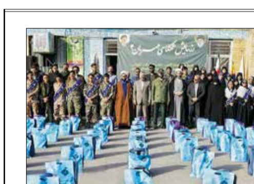
به یاد پدر موشکی ایران، مراسم دوازدهمین سالگرد شهادت حاج حسن طهرانی‌مقدم هفته گذشته برگزار شد. وی یکی از بنیان‌گذاران توان موشکی کشورمان به شمار می‌رود که متولد ۶ آبان ۱۳۳۸ در محله سرچشمه تهران بود. روحش شاد