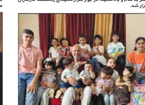
سند زدن! یکی از مدها خانواده فلسطینی در غزه که همه اعضای آن در حملات رژیم جنایتکار صهیونیستی قتل عام شده و کسی از آنها در قید حیات باقی نمانده است. خونخواران تشنه به خون هستند، اما خبر ندارند که بساطشان در حال جمع شدن است و مهمانی به پایان نزدیک شده است.