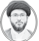
دبیر گروه معارف

شنیده‌اید که هم‌نشینی ما با هر کسی در این دنیا خلق و خوی ما را شبیه او می‌کند، اما آیا می‌دانید این هم‌نشینی لزوماً هم‌صحبتی و همدلی نیست. این تجربه عمومی همه ماست که وقتی در محیطی بوی عطر می‌آید، ما را هم خوش‌بو می‌کند. گاهی در کنار آتش نمی‌نشینیم که لباس ما بوی دود نگیرد. حتی به ما سفارش شده است که با انسان‌های ناباب رفاقت و همراهی نکنیم تا خلق و خوی آنها در ما اثر نگذارد. حال فرض کنید کسی در حال شرارت و اذیت و آزار اهل محل است، آیا می‌توانیم در مقابل آن سکوت کنیم؟ هر کسی در این شرایط باشد، اولین چیزی که به ذهنش می‌رسد آن است که به او تذکر دهد و اگر توجهی نکرد یا قصد اهانت یا حمله داشت، فوری با پلیس تماس می‌گیرد. امیرالمؤمنین (ع) می‌فرماید: «قَلَّ مَنْ تَشَبَهَ بِقَوْمٍ إِلَّا أَوْشَكَ أَنْ يَكُونَ مِنْهُمْ»؛ اگر حلیم و بردبار نبستی، خود را به بردباری و ادب کن و همانند حلیمان عمل کن؛ زیرا کمتر شده است کسی خود را شبیه قومی کند و سرانجام از آنان