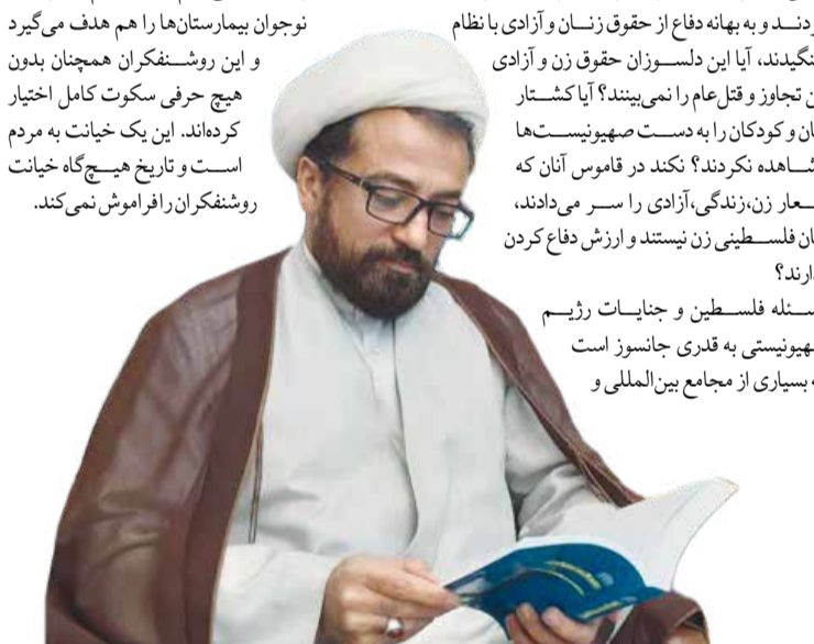
عکس و مکث

موضوع بعدی آن است که مردم خوب درمی‌یابند که این طیف چگونه به مثابه ابزاری در دست سیاست غرب هستند تا بنا به منافع آن حرکت کنند. همچنین رو شدن خود تحقیری روشنفکران ایرانی یکی دیگر از ثمرات سکوت در قبال جنایات صهیونیست‌ها بود. امروزه تمدن وحشی غرب که تجلی‌اش را در رفتار صهیونیست‌ها می‌بینیم، بدون رحم به کودک و نوجوان بیمارستان‌ها را هم هدف می‌گیرد و این روشنفکران همچنان بدون هیچ حرفی سکوت کامل اختیار کرده‌اند. این یک خیانت به مردم است و تاریخ هیچ‌گاه خیانت روشنفکران را فراموش نمی‌کند.