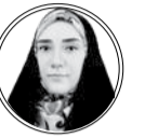
ثمنه اکوان دبیر گروه بین‌الملل

رونمایی از اختلافات آمریکا و صهیونیست‌ها بر سر غزه