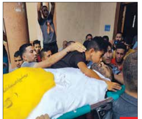
پسری که با پدر خود وداع می‌کند؛ چه چیزی سخت‌تر از این برای یک پسر؟