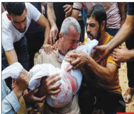
پدربچه که تمام آرزوهای خود برای پسرش را در یک لحظه تمام شده می‌بیند