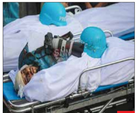
خبرنگارانی که حقیقت را با خون خود عبرت کردند