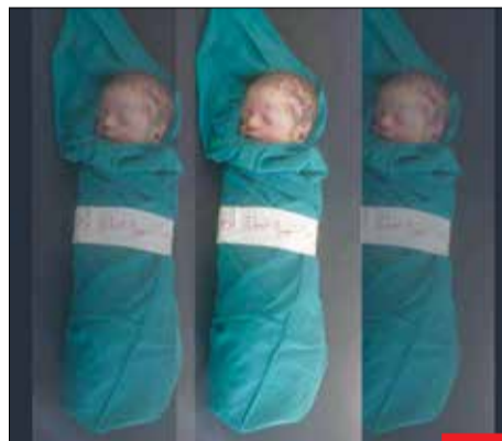
نوزادانی که فاصله بین اذان در گوش تا تلقین شهادت‌شان، هفت روز بیشتر نیست