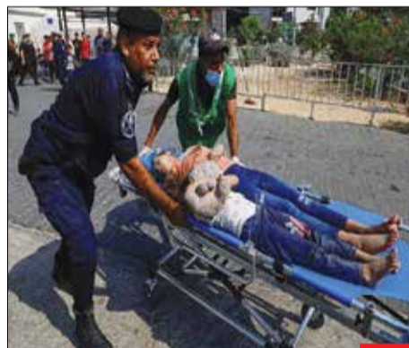
کودکانی که دنیای کودکی‌شان بمب و آوار و عروسک را با هم داشت