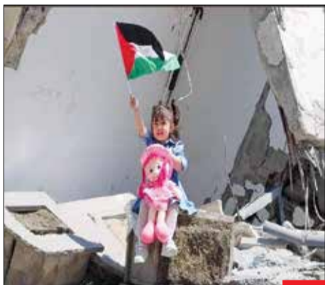
غزه پیروز است، چون امید در آن زنده است...