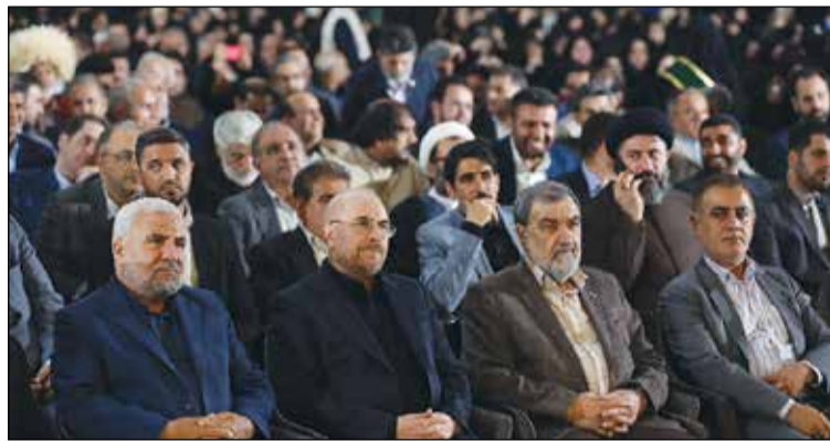
تورم و مسکن کمک کند.»

حداد عادل همچنین یادآور شد که آقای رئیسی تمایل داشته در این جلسه شرکت کنند، اما برای مشغله کاری نتوانست حضور یابد.