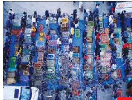
عید در وضعیت جنگی/ تصویری از اقامه نماز عید فطر در خرابه‌های یک مسجد در رفح که نشان می‌دهد نمازگزاران حتی زیر موشک‌باران صهیونیست‌های خونخوار هم در فضای باز به نماز ایستاده‌اند.