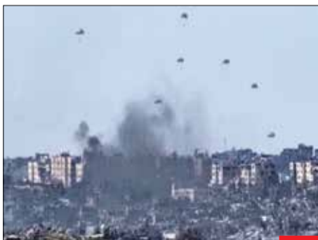
طنز تلخ!/ تصویری از این روزهای شهرهای فلسطین، مبارران و رهاشدن کمک‌های غذایی از آسمان را همزمان می‌توانید نظاره کنید! دنیای امروز خنده‌دار شده است.