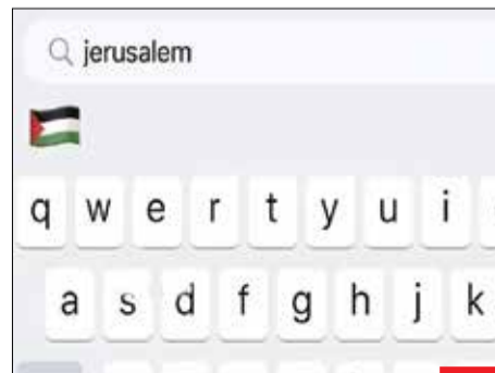
حرف حق!/ شرکت اپل در به روزرسانی سیستم عامل خود، با نوشتن کلمه اورشلیم، پیشنهاد پرچم فلسطین را می‌دهد. این در حالی است که در گذشته، در مقابل اورشلیم، پیشنهاد پرچم رژیم غاصب اشغالگر قدس را می‌داد.