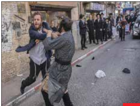
یهودیان حامی فلسطین/ تصویری از سرکوب یهودیان ناطوری کارتا که پرچم فلسطین را در سرزمین‌های اشغالی به اهتزاز درآورده بودند. یهودیان واقعی هم طرفدار فلسطین هستند.