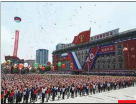
پس از ۲۴ سال، رئیس‌جمهور روسیه با استقبال پرشور مردم کره شمالی و «کیم جونگ اون» رهبر این کشور روبه‌رو شد؛ سران روسیه و کره شمالی در میدان «کیم ایل‌سونگ» شهر پیونگ‌یانگ دیدار کردند.