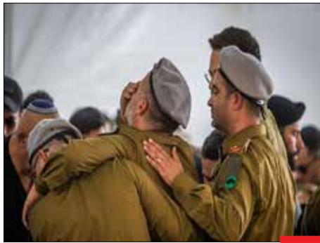
آچمز! / رژیم صهیونیستی با وجود استفاده همه‌جانبه از تسلیحات هوایی و زمینی، تاکنون تعداد قابل توجهی از نظامیان و افسران نخبه خود را در نبرد غزه از دست داده و گریبه و زاری، وضعیت هر روز آنها شده است.