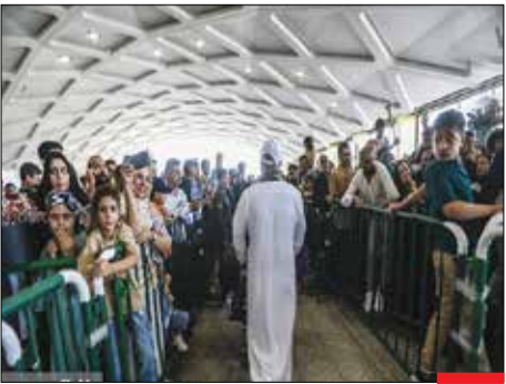
بازگشت زائران/ نخستین کاروان زائران سرزمین وحی با پرواز هواپیمایی جمهوری اسلامی ایران وارد فرودگاه بین‌المللی شهید هاشمی‌نژاد مشهد مقدس شد. با پایان یافتن حج امسال، حجاج ایرانی کم کم به کشور باز می‌گردند.