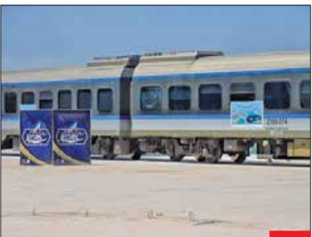
بادگاری ماندگار/ راه آهن «رشتت کاسپین» با حضور «محمد مخبر» سرپرست نهاد ریاست‌جمهوری در گیلان به بهره‌برداری رسید. طرح‌های ماندگار دولت شهید رئیسی حتی پس از او هم در صف بهره‌برداری هستند.