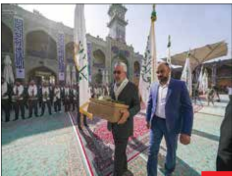
عید ولایت/ خدامان آستان نورانی علوی پرچم عید سعید غدیر خم را بر فراز ایوان طای حرم امیرالمؤمنین (ع) به اهتزاز درآوردند. این مراسم همزمان با دهه امامت هر سال در حرم علوی برگزار می‌شود.