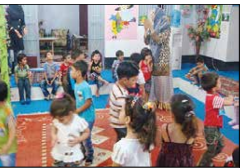
در مهدیای کودک چه می‌گذرد؛ از رقص تا استخر مختلط! مواظب باشید