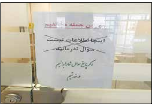
آخرین بر این روحیه: «اگر پاسخ سؤال شما را بدانیم در خدمتیم»