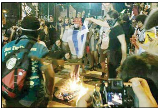
به آتش کشیدن پرچم رژیم صهیونیستی در آمریکا