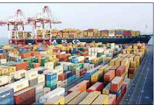
قاچاق کالای خارجی است که به پشت نظام وارد می‌شود. شما حمایت نکنید!