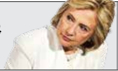
پرتاب سه امتیازی

عربستان که دستان خود را در این نشست خالی دید، با ترویج ایران‌هراسی از طریق کشورهای ذره‌بینی اتحادیه، آن هم با رشوه‌های کلان که به آنها پرداخته، به دنبال پنهان‌سازی این شکست و نمایش یک پیروزی برای خود بود. نکته مهمی که در زمینه نشست اتحادیه عرب بسیار مهم است، انحراف شدید آن از مسئله فلسطین است. هر چند در ظاهر ادعای حمایت از فلسطین مطرح شد، اما دو اصل در آن وجود دارد: نخست آنکه هدف، آوردن رژیم صهیونیستی پای میز مذاکره مطرح شد، نه مبارزه با آن. حال آنکه فلسطین به حمایت برای مبارزه نیاز دارد نه سازش، دوم آنکه تهدید رژیم صهیونیستی، نه اشغالگری و جنایت‌ش علیه فلسطین و منطقه، بلکه تهدیدات هسته‌ای احتمالی آن عنوان شده است؛ یعنی اتحادیه عربی که در گذشته مقابله با رژیم صهیونیستی را به مثابه دهمین هدف داشت، اکنون با ادعای تهدید هسته‌ای بودن صرفاً خواستار اقدام جهانی برای عضویت این رژیم در ان‌پی‌تی شده است و این یعنی خیانت آشکار و گسترده به فلسطین.