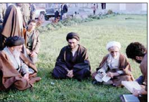
حضرت آیت‌الله خامنه‌ای، آیت‌الله جنتی و شهید آیت‌الله مدنی در بازدید از جبهه‌ها