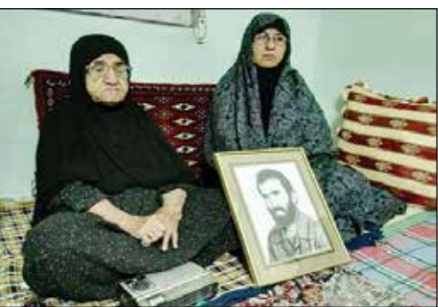
مادر شهید اسدپور پس از ۲۲ سال خبر شناسایی فرزندش را شنید و رادیو را کنار گذاشت