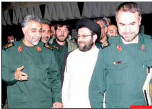
مردی که در میدان سیاست هم بصیرت داشت