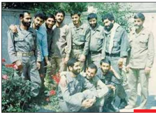
کم شد ز جمع سوتهدلان یار دیگری...