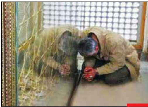
راز و نیاز با خدای خود کنار ضریح حضرت زینب (س)