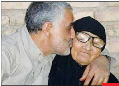
عشق به مادر