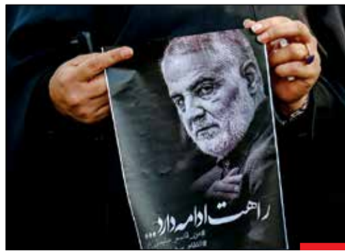
بکشید ما را؛ ملت ما بیدارتر می شود...