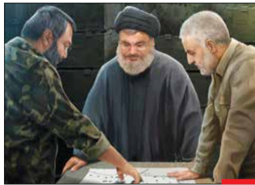
سال ها خواب را از چشمان مبهیونبست ها ربوده بود