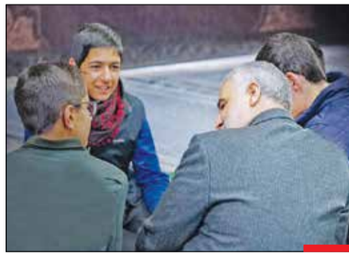
پدری مهربان برای همه فرزندان اسلام...