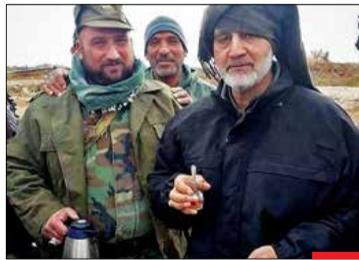
خاکی ترین سردار دل ها