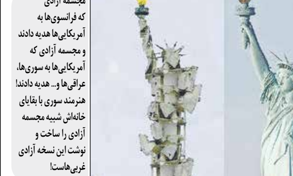
مجسمه آزادی که فرانسوی‌ها به آمریکایی‌ها هدیه دادند و مجسمه آزادی که آمریکایی‌ها به سوری‌ها، عراقی‌ها و... هدیه دادند! هنرمند سوری با بقایای خانه‌اش شبیه مجسمه آزادی را ساخت و نوشت این نسخه آزادی غربی‌هاست!