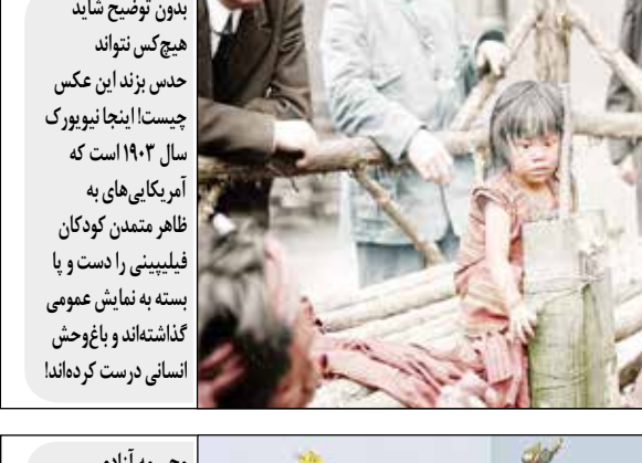
بدون توضیح شاید هیچ‌کس نتواند حدس بزند این عکس چیست! اینجا نیویورک سال ۱۹۰۲ است که آمریکایی‌ها به ظاهر متمدن کودکان قلیبیایی را دست و پا بسته به نمایش عمومی گذاشته‌اند و باغ وحش انسانی درست کرده‌اند!