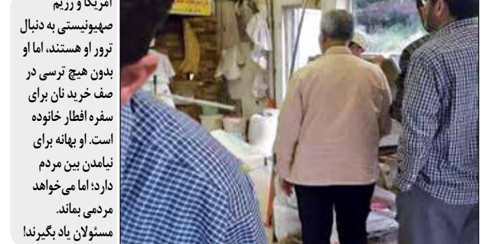
آمریکا و رژیم صهیونیستی به دنبال ترور او هستند، اما او بدون هیچ ترسی در صف خرید نان برای سفره افطار خانواده است. او بهانه برای نیامدن بین مردم دارد؛ اما می‌خواهد مسئولان بگیرند!

روی خط خبر تقاضا برای مرد تکراری «مجید انصاری» به تازگی گفته است: «شخصیتی مثل آقای خاتمی در دوران ریاست‌جمهوری خود، محبوبیت، مقبولیت و اعتباری در بین کشورهای اروپایی و سازمان ملل داشتند... چرا در این ایام که باید ما دیپلماسی فعال‌تری داشته باشیم از ظرفیت ایشان برای همراه کردن کشورهای جهان با ایران و خنثی‌سازی توطئه‌ها و تحریم‌ها استفاده نمی‌کنیم؟» شخصیت متین و نجیب‌ا‌مورد اشاره او کسی است که با نانچیبی تمام، فتنه سال ۸۸ را بر رهبری نظام و ایران و متعاقب آن، سنگین‌ترین تحریم‌های تاریخ را بر مردم تحمیل کرد و هنوز هم با اینکه در خفی اذعان کرده است تقلبی در کار نیست؛ اما به طور آشکار از عذرخواهی ایا دارد. «محمد خاتمی» نه تنها در دولت خودش نتوانست تحریم کلاتی را علیه ایران لغو کند، بلکه نسخه‌های شبه برجامی او نیز هیچ موفقیتی برای کشور به همراه نداشت و دست آخر نیز شکست خورد.