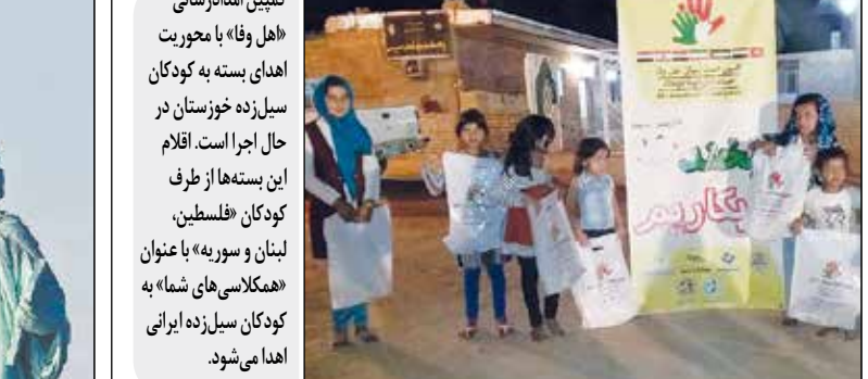
کمپین امدادسانی «هل وفا» با محوریت اهدای بسته به کودکان سیزده خوزستان در حال اجرا است. اقلام این بسته‌ها از طرف کودکان فلسطین، لبنان و سوریه» با عنوان «همکلاسی‌های شما» به کودکان سیزده‌زاده ایرانی اهدا می‌شود.