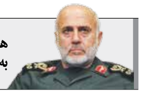
هدشار به دشمن

سرلشکر غلامعلی رشید، فرمانده قرارگاه مرکزی خاتم‌الانبیاء(ص) با بیان اینکه ما با بازتولید قدرت دفاعی و ثبات سیاسی، قدرت کنونی را به دست آوردیم و مردم بدانند که نیروهای مسلح فرزندان جان بر کف آنان هستند که زندگی خود را وقف تأمین ثبات و امنیت کشور کرده‌اند، گفت: به دشمن هدشار می‌دهیم درباره قدرت و اراده ملت ایران، دچار اشتباه در محاسبه نشود که پرهزینه خواهد بود.