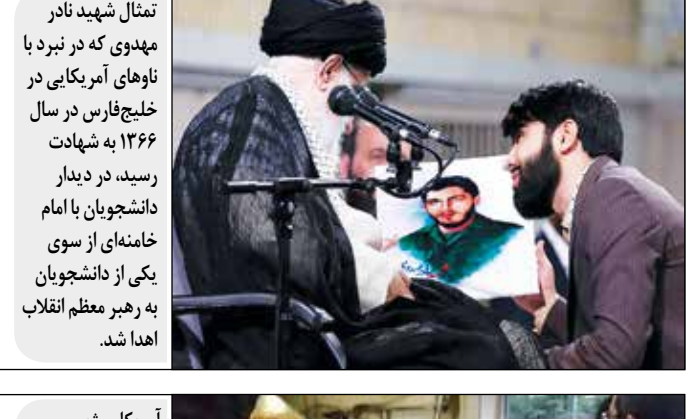
تمثال شهید نادر مهدوی که در نبرد با ناوهای آمریکایی در خلیج فارس در سال ۱۳۶۶ به شهادت رسید، در دیدار دانشجویان با امام خامنه‌ای از سوی یکی از دانشجویان به رهبر معظم انقلاب اهدا شد.