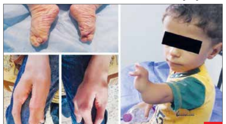
میراث ماندگار آمریکایی‌ها برای عراقیان / به کارگیری مواد سمی و هسته‌ای در تسلیحات به کار برده شده در جنگ آمریکا با صدام و عراق، هنوز تأثیراتش بر روی مردم عراق قابل مشاهده است. تولد شمار قابل توجهی از کودکان ناقص‌الخلق در مناطق بمباران شده به دلیل وجود میزبان بالایی از ترکیبات اورانیومی در بدن این کودکان.