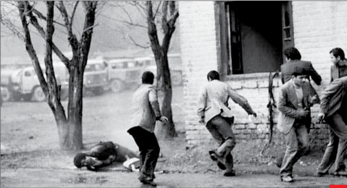
نمایی از آشوب‌های مسلحانه منافقین در دهه ۶۰

می‌آمدند و می‌گفتند. دوم اینکه من خودم مطالبی داشتم که باید به اینها می‌گفتم به عنوان اتمام حجت، که خدای نکرده بعدها [در] دل خود نماند که چرا حرف‌هایم را به اینها نگفتم و اینها نگویند که امام حرف‌هایش را به ما نگفته بود و آنها هم آنجا به من قول دادند که حرف‌های مرا برای دوستان‌شان هم نقل کنند.»