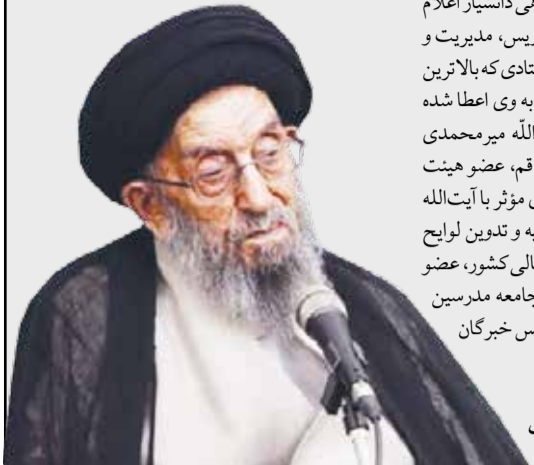
روحش شاد و یادش گرامی

نگاهی به زندگی آیت الله سید ابوالفضل میر محمدی