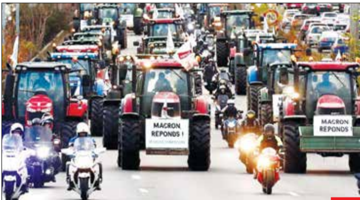
نوبتی هم باشه تویت کشاورزهاست! در فرانسه یک روز شیرفروش‌ها اعتراض می‌کنند، یک روز پمپ بنزینی‌ها، یک روز فعالان محیط زیست، شبیه‌ها که اختصاص داره به حلیقه زردها و تا مدت‌ها برنامه اعتراض زورور شده است؛ واقعا خیلی سخته که این وسط کشاورزها تونستن یک جا خالی پیدا کنن برای قرق کردن خیابون‌ها و اعتراض به سیاست‌های مکرون!