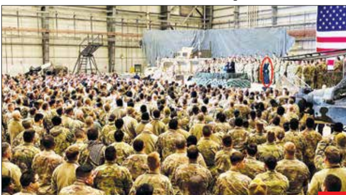
در کشور خودت میزبان رئیس‌جمهور کشور دیگری باشی، اما نه قبلش خبر داشته باشی، نه نشانی از پرچم کشورت باشه در ملاقات، مجبور به دیدار باشی و... آخرشم تو تصویر باید دورت حفظ قرمز بنزن تا بین بیگانگان در کشورت در تصویر معلوم بشی! ترامپ بدون اطلاع قبلی با سفر به افغانستان و تحقیر دولت ملت موجب خشم مردم این کشور شد.