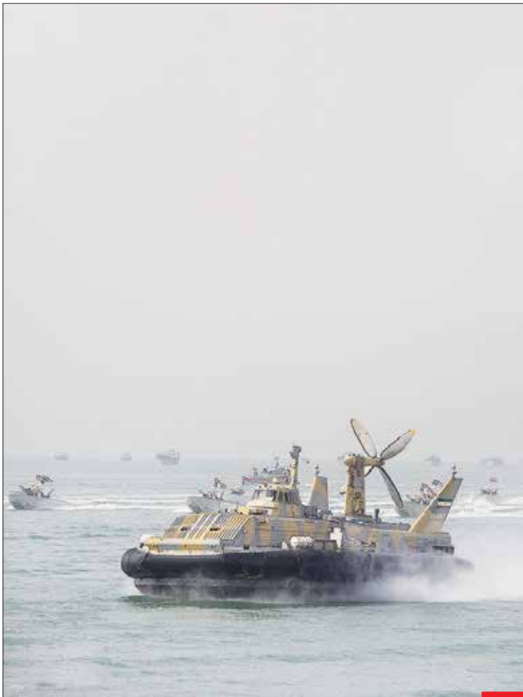
رژه قایق‌های تندرو سپاه پاسداران در خلیج فارس

مواضع قاطعانه و هوشمندانه فرماندهان ارشد