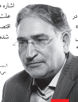
بی نوشت: ۱- به اخراجی های کیهان بست می دهند؟! ستون «کیهان و خوانندگان» روزنامه کیهان، ۱۶ دی ۱۳۹۱.

وی در یکی از یادداشت های خود در روزنامه کیهان «سید محمدعلی ابطحی» را به دلیل پوششیدن شلوارک در سواحل لبنان به باد انتقاد گرفت؛ البته باید توجه داشت که در حال حاضر بین آقای ابطحی و نوری زاد به سبب رفتار