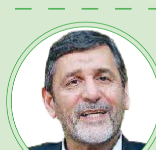
دکتر محمدحسین صفارهرندی

این شهید بزرگوار شخصیتی چندبعدی و چندوجهی داشت. ایشان علاوه بر اینکه یک فرد نظامی و یک سرباز واقعی در سنگر های دفاعی بود، یک سیاستمدار برجسته نیز به شمار می آمد، در عین حال یک عارف، مهذب، عابد و زاهد هم بود. جمع این ابعاد شخصیتی را کمتر در یک انسان دیده ایم؛ به همین دلیل واقعا ایشان در جامعه ما محترم شناخته می شد. قبل از شهادت، ایشان در نظر سنجی ها بالاترین جایگاه را از نظر محبوبیت داشت؛ اما متأسفانه شاهد آن هستیم که برخی افراد و جریان ها می خواهند این جایگاه ناشناخته باقی بماند و در گذر زمان مهجور واقع شود.