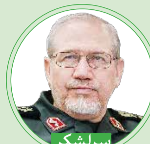
سرلشکر سیدیحیی صفوی

برادرمان، قاسم سلیمانی تربیت شده انقلاب اسلامی و دفاع مقدس بود. اخلاق و روحیات او در فضای ادبیات و روحیات حضرت امام (ره) شکل گرفت؛ البته برادر قاسم روی خود نیز خیلی کار می کرد و زحمت می کشید و به عبادات، زیارات و نمازهایش توجه داشت که برای رسیدن به چنین مقامی بسیار مؤثر بود. ایشان همه ویژگی های مدیریت جهادی را به نحو کامل داشت.