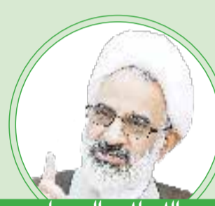
حجت الاسلام والمسلمین دکتر حاجی صادقی

سلیمانی محصول نماز شب و مصداق بارز آیه «محمد رسول الله و الذین معه اشداء علی الکفار رحماء بینهم» بود. او آموخته بود که در میدان جنگ اگر کوه ها بجنبند، تو نباید بجنبی و هرگز به دشمن پشت نمی کرد؛ اما از سوی دیگر برای مؤمنان خاضع و خاکی بود، بال های تواضع او در همه جا باز بود. او ۴۱ سال لباس جهاد را از تن به در نکرد و همواره در حال جهاد و احیاگر مکتب جهاد و شهادت بود. او رخساره میدانی ولی فقیه بود و جز به اوامر رهبر عظیم الشان مان به چیز دیگری نمی اندیشید. هر جا مظلومی بود، قاسم و سپاهش آنجا بودند و می جنگیدند و سپر بلا می بودند و چون مالک اشتر همواره به خیمه دشمن نزدیک بود.