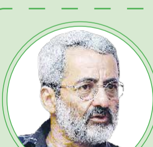
عباس سلیمی نمین

رفتار شهید سلیمانی بیشتر دارای جاذبه بود و از تمام گروه های سیاسی به سمت ایشان جذب می شدند؛ در واقع، ایشان مصداق این موضوع بود که در عین انقلابی گری عضو هیچ گروه یا حزب خاصی نبود و خط مستقیم انقلاب را طی کرد و در این میان سیاستمداری قهار هم بود. در جلسات مختلف که متوجه می شدیم شهید سلیمانی هم فرار است شرکت کند، می دانستیم یکی از بهترین جلسات را تجربه خواهیم کرد؛ وقتی ایشان شروع به صحبت می کرد، خیلی راهبردی، دقیق و با اشراف کامل منطقه و وضعیت جبهه مقاومت را تجزیه و تحلیل می کرد.