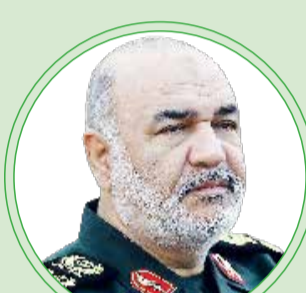
سرلشکر حسین سلامی

حاج قاسم چون بنده خدا بود، از سلسله مراتب ولایت اطاعت می کرد و انسانی اهل عمل صالح بود، در دل مردم جا دارد. او بعد از جنگ هم به جهاد روی آورد و جهاد برای او عمل صالح بود. محبوبیت و مقبولیت شهید حاج قاسم سلیمانی در بین احاد مختلف و اقشار جامعه و ملت عزیز ایران و از سوی دیگر، در بین جوانان کشورهای اسلامی و آزادی خواه، نویدبخش پیروزی های بزرگ و قطعی جبهه مقاومت اسلامی خواهد بود.