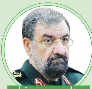
سردار محسن رضایی

برادرمان، قاسم سلیمانی تربیت شده انقلاب اسلامی و دفاع مقدس بود. اخلاق و روحیات او در فضای ادبیات و روحیات حضرت امام (ره) شکل گرفت؛ البته برادر قاسم روی خود نیز خیلی کار می کرد و زحمت می کشید و به عبادات، زیارات و نمازهایش توجه داشت که برای رسیدن به چنین مقامی بسیار مؤثر بود. ایشان همه ویژگی های مدیریت جهادی را به نحو کامل داشت.