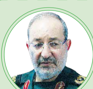
سردار سیدمسعود جزایری

همه فرماندهان سرباز ولایت هستند، ولی حاج قاسم ممتاز بود. ولایت محوری دو بعد بزرگ دارد اول؛ درک صحیح از ولایت و اینکه باور داشته باشد که آنچه ولایت می گوید حکم الله است و دوم تعبد به ولایت است. حاج قاسم نسبت به ولایت قدرت فهم بالایی داشت؛ از جمله کسانی بود که اشاره حضرت اقا را می فهمید؛ نه تدابیر، بلکه منویات رهبری را هم می فهمید. حاج قاسم همچنین به ولایت تعبد عقلانی داشت. تعبدی که بر قوی ترین عقلانیت استوار است. این ولایتمداری حاج قاسم خیلی کارساز است. هم سنگران او هم، رمز موفقیت های حاج قاسم را همین می دانستند.