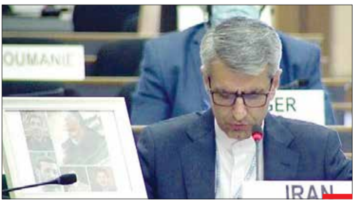
شهباز نور در میان مدعیان مبارزه با ترور/ قاب عکس شهباز نور «حاج قاسم سلیمانی» هنگام سخنرانی نماینده دائم ایران در شورای حقوق بشر روی میز قرار گرفت، اما نظانی بعد نیروهای امنیتی، این قاب را از روی میز برداشتند. حاج قاسم با آنان چه کرده است که حتی از تصویر او و پاراننش هم ترس و واهمه دارند؟ باید از مردان خدا باشی تا دشمن از تصویرت هم بترسد.