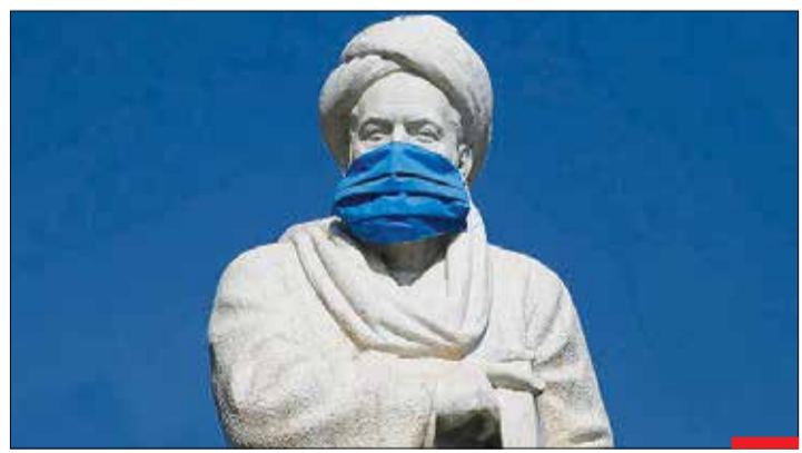
بوعلی سینا، پدر علم پزشکی دنیا هم ماسک زد، اما بعضی‌ها هنوز می‌کنن کرونا برای بقیه هستن! / با اجباری شدن استفاده از ماسک در محیط‌های عمومی، مردم شهرهای مختلف برای جلوگیری از شیوع بیماری کووید ۱۹، با ماسک در مکان‌های عمومی ظاهر می‌شوند. کرونا در روزهای گذشته، جان تازه گرفته است و بیش از پیش قربانی می‌گیرد. هوای همدیگر را داشته باشیم.