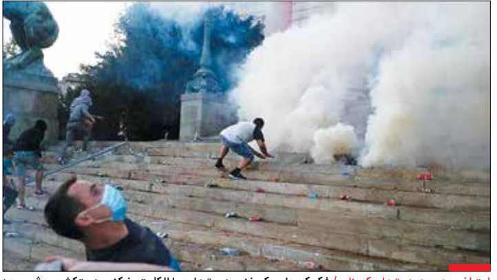
اعتراف به محدودیت‌های کرونایی/ فکر کن ماسک بزنی، دست‌ها رو با الکل تمیز کنی، دستکش بپوشی، بعد بیایی به ساختمان مجلس سنگ بزنی که چرا به علت شیوع کرونا محدودیت و قرنطینه ایجاد کردی. برخی معترضان در مریدستان با حمله به مکان‌های دولتی اعتراض خودشان را به تصمیمات دولت برای حفظ جان مردم نشان دادند.