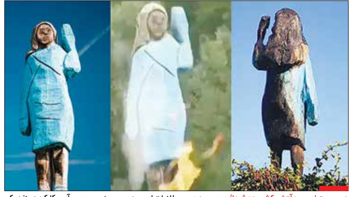
همسر ترامپ به آتش کشیده شد! / مجسمه چوبی ملانیا ترامپ، همسر رئیس‌جمهور آمریکا که در نزدیکی شهر زادگاهش در اسلوونی نصب شده بود، در روز استقلال آمریکا، چهارم ژوئیه آتش زده شد. ساخت این مجسمه با انتقادهایی همراه بود و برخی آن را «مجسمه بدحاشاش» و «مایه شرمساری» توصیف کردند.