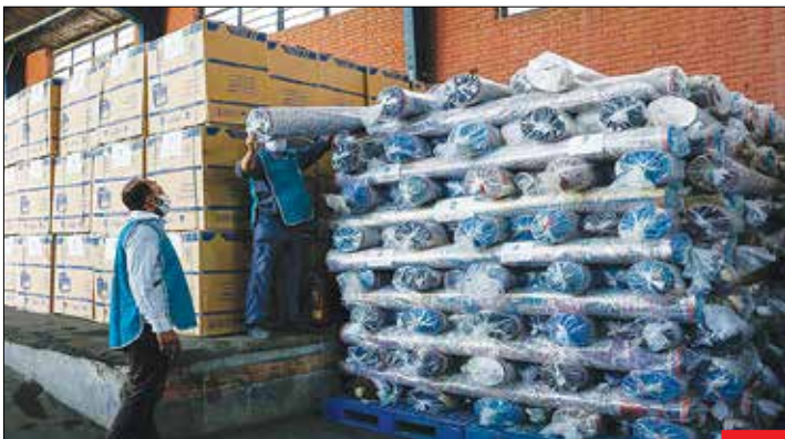
کمک به تسهیل ازدواج جوانان / چهار هزار سری جیبیه از سوی بنیاد مستضعفان به زوج‌های جوان تحت پوشش حمایتی کمیته امداد امام خمینی (ره) اهدا شد. با توجه به همه‌گیری بیماری کرونا و از رونق افتادن فعالیت‌های اقتصادی، بسیاری از جوانان برای آغاز زندگی مشترک خود با مشکلاتی مواجه هستند که توجه بیشتر افراد خیر را می‌طلبد.