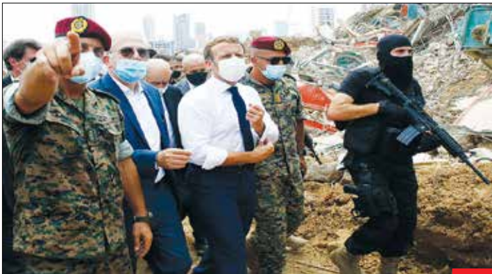
قابل همیشه به صحنه جرم باز می‌گردد / مکرون رئیس‌جمهور فرانسه برای بازدید از محل انفجار بندر بیروت، تحت تدابیر شدید امنیتی به این شهر سفر کرد. لبنان چند ماهی است که با دسیسه غربی‌ها درگیر مشکلات اقتصادی است و انفجار اخیر بیروت هم شاید قطعه تکمیلی پازل فشار بر این کشور باشد و سفر مکرون ادامه برنامه غرب برای این کشور!