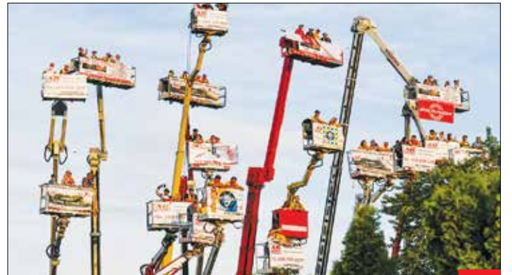
از در بیرونش می‌کنی، از پنجره می‌آد تو! / اینها هواداران تیم فوتبالی در لیبستان هستند که به دلیل شرایط کرونایی، ورودشان به ورزشگاه برای تماشای بازی ممنوع شده است؛ اما عاشق فوتبال را کرونا هم جلودار نیست؛ این افراد با کرایه بالابرای ساختمانی، به کنار ورزشگاه رفتند و بازی تیم‌شان را تماشا کردند!