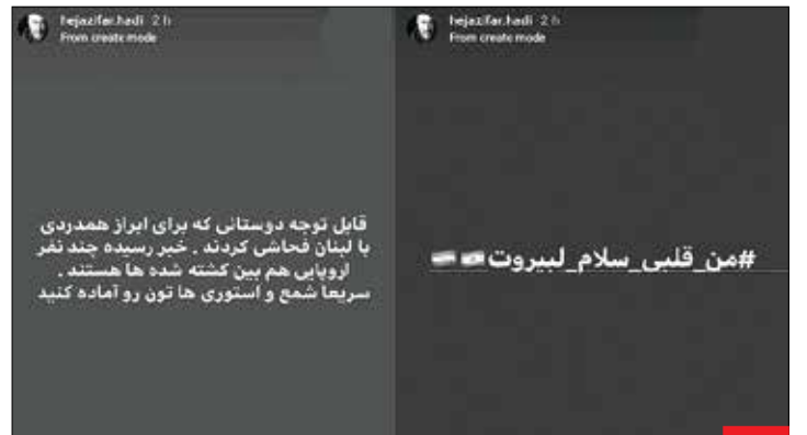
هیس... سلبریتی‌ها حق را فریاد نمی‌زنند! / هادی حجازی‌فر در صفحه شخصی خود با مردم لبنان هم‌دردی می‌کند؛ ولی برخی به او می‌زنند و فحاشی می‌کنند، تا جایی که او مجبور به پاسخ دادن به آنها می‌شود. آیا اگر حادثه لبنان در یکی از شهرهای اروپایی بود، تا چندین روز مجبور نبودیم تصاویر مشککی عزا و آه و ناله سلبریتی‌ها را برای جان‌باختگان در پست‌های اشتراکی‌شان تحمل کنیم؟