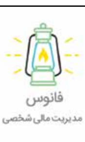
فانوس مدیریت مالی شخصی

«فانوس» ارزش به‌روز دارایی‌های ارزی، طلا و بورسی و تغییراتش را به شما نشان می‌دهد. حسابداری شخصی فانوس با تحلیل کدال بورس به‌صورت رایگان به شما در خرید و مدیریت سهام کمک می‌کند و شما می‌توانید تمام اطلاعات به‌روز وام‌های بانکی کشور را در این برنامه کاربردی ببینید. فانوس به صورت خودکار و رایگان هزینه‌ها و درآمدها را ثبت کرده، آنها را هوشمندانه مدیریت کرده و در نهایت به شما پیشنهادهای اقتصادی می‌دهد. همچنین، این برنامه به شما گزارش‌های جالب و کاربردی می‌دهد.