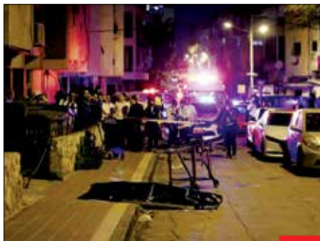
خیال تو خالی امنیت! نفتالی بنت از شهرک‌نشینان رژیم مهبونیستی خواسته است هنگام حضور در محیط‌های عمومی، اسلحه داشته باشند؛ به زودی حمل اسلحه به محیط‌های خصوصی‌تان هم کشیده خواهد شد...