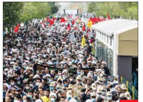
سلاش برای جدایی دو ملت! حضور پرشور افسار گوناگون مردم از دو ملیت ایرانی و افغانستانی در کنار هم در مراسم تشییع شهدای حادثه حرم مطهر رضوی، پایان خوش‌خیالی رسانه‌های معاند برای ماهی‌گیری از این حادثه بود