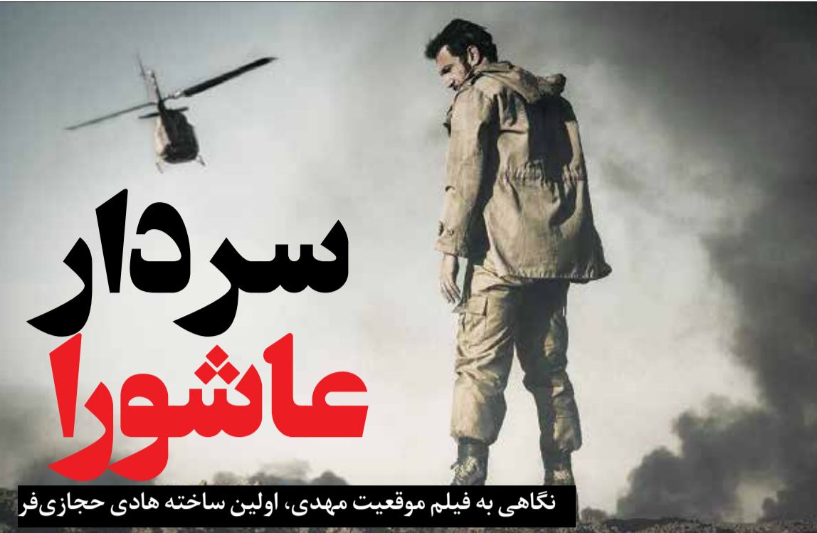
نگاهی به فیلم موقعیت مهدی، اولین ساخته هادی حجازی‌فر

در نهایت، آنچه همیشه پس از دیدن فیلم‌های دفاع مقدسی تداعی می‌شود، به یادآوردن مردانی است که اگر دریاها مُرُکب شوند و درختان قلم و دوربین‌ها روایتگر، تنها قطره‌ای از دریای مردانگی و دل‌آوری‌های‌شان را می‌توان به تصویر کشید.