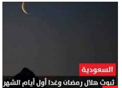
ثبوت هلال رمضان و غدا اول ایام الشهر مطمئنید ماه رو دیدین؟! یکی از کاربران شبکه‌های اجتماعی خطاب به سعودی‌ها گفت: شما پهبادهای یمنی در ارتفاع هزار متری را نمی‌بینید، انتظار دارید دیدن ماه و اعلام شروع ماه رمضان را از سوی شما باور کنیم!