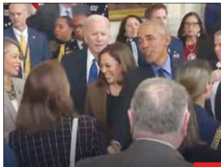
چو تخته پاره بر موج، رها رها من! فیلمی که به تازگی از اولین روزهای ریاست‌جمهوری بایدن منتشر شده است، نشان می‌دهد او چگونه در مراسم استقبال از خودش، در یک گوشه به تنهایی رها شده و توجهات به سمت او بازمست!