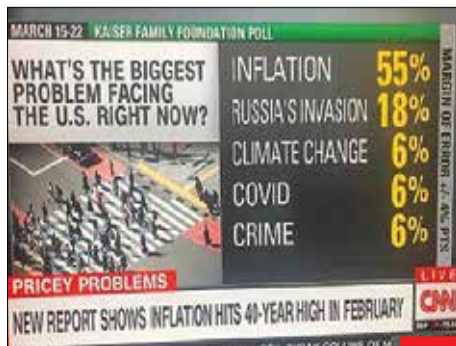
تورم سرسام‌آور! براساس نظرسنجی شبکه خبری سی‌ان‌ان، بزرگ‌ترین دغدغه این روزهای مردم آمریکا، تورم است که حتی بالاتر از جنگ روسیه و اوکراین قرار گرفته است. تورم در آمریکا، رکورد ۴۰ ساله خود را زده است!