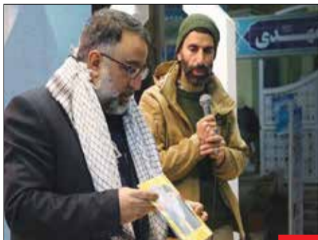
شهره برای جهادگران! شهادت، مستند غم‌هایی بود که شهید حاج اسماعیل احمدی از دل بینیان و محرومان در دل کوه‌های دوردست برداشت. این شهید بزرگوار دنبال سخنی و مشکل بود و برای جهادگران نامی آشنا بود. شهید احمدی هفته پیش در سانحه سقوط بالگرد به شهادت رسید.