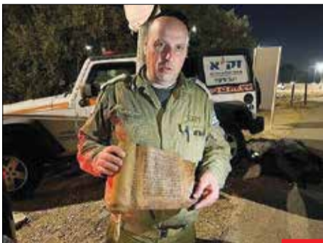
همان عادت همیشگی! گروه امداد رژیم صهیونیستی که برای کمک به زلزله‌زدگان ترکیه‌ای به این کشور اعزام شده بود، برخی از نسخ خطی باستانی را از کتیبه ویران‌شده آنتاکیه به سرعت بردند؛ غارت در خون این آبروبریان انسانیت نهادینه شده است!