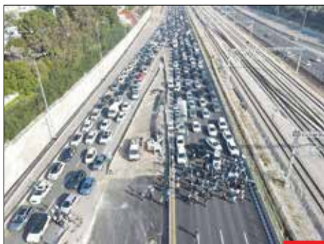
چه آشنا! صهیونیست‌های شهرک‌نشین در اعتراض به سیاست‌های دولت اقدام به بستن بزرگراه‌ها و مسدودکردن مسیر عبورمروور کردند؛ چه آشناسنت این تصاویر، ماه‌ها گذشته بود که به همین شکل آشوب‌گران مواج‌بگیر از صهیونیست‌ها در شهرهای ایران اقدام به اغتشاش می‌کردند.