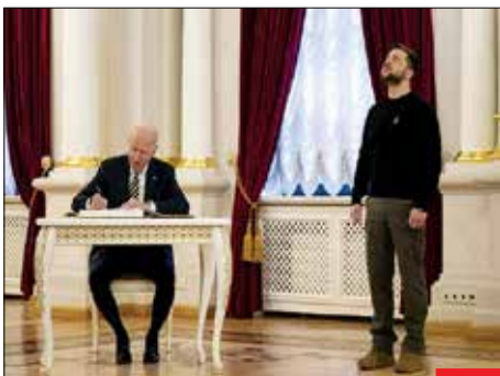
زبان تحقیر! این تصویر یک نمونه آشکار از زبان بدنی است که تحقیر را به نمایش می‌گذارد؛ رئیس‌جمهوری که کشورش را سر وعده‌های توخالی غرب به سیاهی کشانده است و همچنان چشم‌انتظار کمک‌های آنها مانده است! غریبان همین عاقبت را برای ایرانیان هم می‌خواهند!