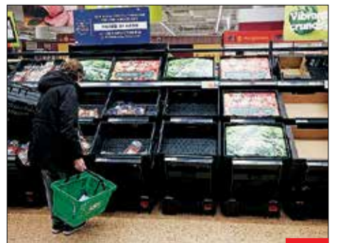
نیست، نگرد! تخم‌مرغ و گوچه‌فرونگی و سایر سبزیجات براستفاده در فروشگاه‌های انگلیس کمیاب یا چیره‌بندی شده است. این کشور، نخستین کشور در اروپاست که وارد دوره رکود اقتصادی شده و نرخ تورم با جهش پنج برابری به بالاترین حد در نیم قرن گذشته رسیده است؛ اما بی‌بی‌سی هنوز نفهمیده است!