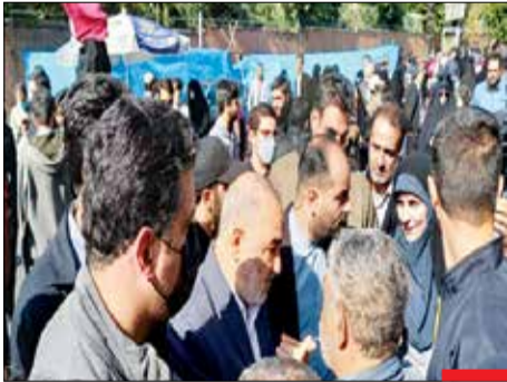
سردار سلامی در تجمع پرشور ۱۳ آبان درباره مطالبه مردم برای گرفتن انتقام خون شهدا گفت: در طول این مسیر که در راه پیمایی می آید مردم فقط ندای انتقام سمری دادند هم دشمنان و هم ما به خوبی می دانیم که این انتقام گرفته خواهد شد.