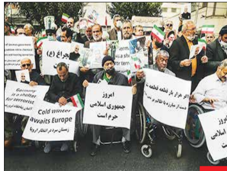
در پی راهپیمایی معاندان نظام اسلامی در برلین و نیز اظهار نظر برخی از مسئولان این کشور علیه نظام اسلامی، جمع کثیری از جامعه اپنارگران در کنار آحاد مختلف مردم، مقابل سفارت آلمان به تجمع اعتراض آمیز دست زدند. در این راهپیمایی جانبازان شهیدایی و مجروح حضور داشتند.