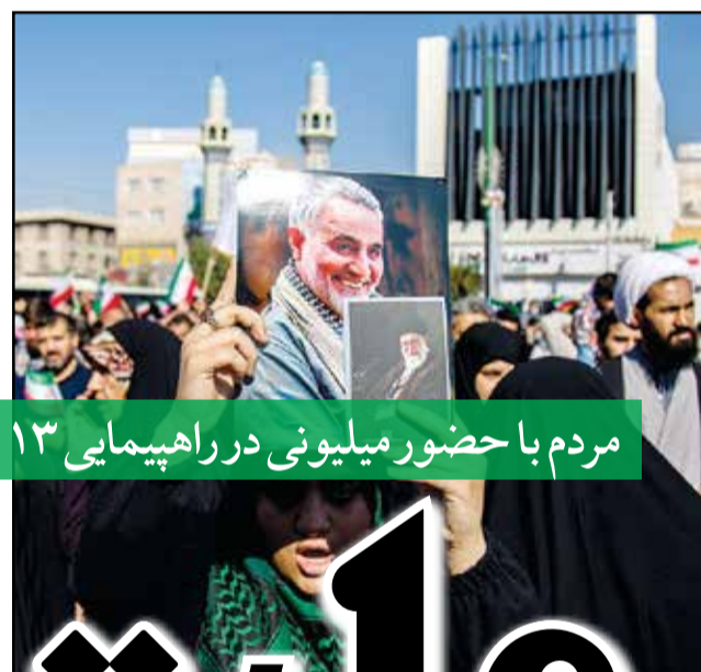
مردم با حضور میلیونی در راهپیمایی ۱۳ آبان دشمنان ایران را ناامید کردند