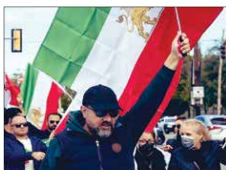
خدا عاقبت‌مان را بخیر کند/ امام صادقی (ع): کسی که با رفیق بد همشین شود، سالم نمی‌ماند و سرانجام به ناپاکی آلوده می‌شود. برزرو ارحم‌ند و احسان گرمی سرانجام خود واقعی‌شان را نشان دادند.