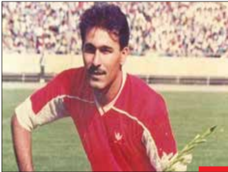
خدا حافظ جانباز فوتبال ایران/ کریم باوی، ستاره سابق فوتبال ایران و باشگاه‌های شاهین و پرسپولیس که جانباز جنگ تحمیلی هم بود، پس از تحمل یک دوره بیماری در ۵۸ سالگی دار فانی را وداع گفت. خدا او را بیامرزد