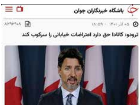
فقط ما حق داریم! / نخست‌وزیر کانادا: ما حق سرکوب اعتراضات مردم را داریم. نخست‌وزیر انگلستان: پلیس اختیارات ویژه برای سرکوب مردم دارد. همین دو نفر هنگام برخورد با وقایع ایران؛ بگذارید مردم حرف بزنند!