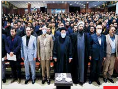
دانش خاموشی ندارد/ رئیس‌جمهور در ابتدای دیدار با دانشجویان؛ برخی به من تومیه کردند امروز به دانشگاه نروید؛ من معتقد به تعطیلی علم و دانش نیستم و به دنبال گشایش هستم؛ آیندسازان کشور، دانشجویان و دانش‌آموزان هستند.