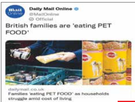
غذای حیوانات برای فقرا! / خبریه‌های بریتانیایی هشدار داده‌اند خانواده‌های این کشور در بحران افزایش هزینه‌های زندگی به خوردن غذای حیوانات و گرم کردن غذا روی رادیاتور و شمع رو آورده‌اند!