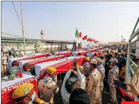
رود پیکر مطهر ۱۱۱ شهید تازه تفحص‌شده به ایران/ شتاور میاد حامل پیکر ۱۱۱ شهید دوران دفاع مقدس با استقبال مردم قدرشناس شهرستان‌های آبادان و خرمشهر از مسیر آبراه بین‌المللی ارون‌دروود وارد اسکله بندر آبادان شد.