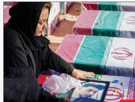
چه مبری دارد مادر.../ مراسم وداع و تشییع پیکر شهدای انفجار تروریستی در گلزار شهدای کرمان با حضور رئیس‌جمهور در مصلی امام علی(ع) شهر کرمان برگزار شد. مادری که ساعتی قبل هدیه روز مادر گرفته بود، این‌گونه فرزندش را بدرقه می‌کند.