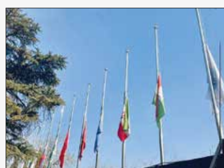
همه به یاد شهدای کرمان/ به احترام شهدا و قربانیان حادثه تلخ تروریستی زائران گلزار شهدای کرمان و حاج قاسم سلیمانی دیرخانه سازمان همکاری‌های منطقه‌ای واقع در یکن، پرچم سازمان و اعضا را به حالت نیمه برافراشته درآورد.