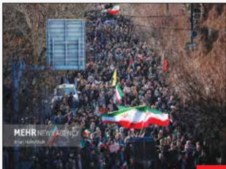
خروش مردم داغدار/ تمام ایران در ماتم شهدای حمله تروریستی کرمان هستند و مردم شهرهای مختلف این‌گونه برای محکوم کردن جنایت تروریستی در کرمان گرد هم آمدند. تصویر حضور مردم همدان را نشان می‌دهد.