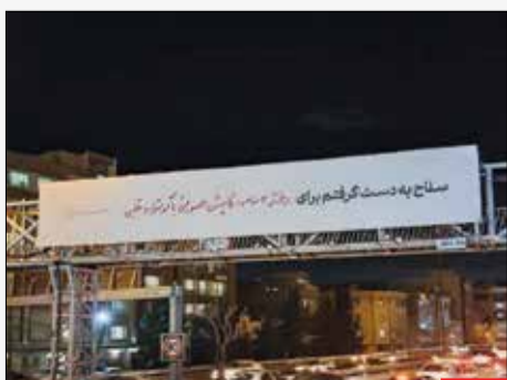
تابلوهایی که به روز شدند/ در حالی که شهرداری تهران تابلوهایی مراسم سالگرد حاج قاسم را با توجه به وقایع گذشته زده بود، با حادثه کرمان این تابلوها به روز شدند. نشان داد خضاب پر برای دفاع از مظلومان باید در دست پیروان راه حاج قاسم باشد.