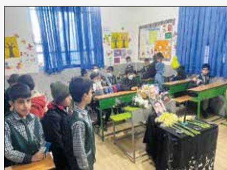
جای خالی/ امروز جای ۲۰ دانش‌آموز در مدرسه خالی است. دانش‌آموزان جنایت تروریستی کرمان که بار دیگر ثابت کردند نوجوانان و دانش‌آموزان اسطوره رشادت و ایثار هستند وبا وجود سن کم ایمانی قوی و روحیه شهادت طلبی دارند.