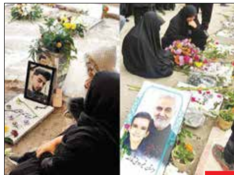
داعی که خاموش نمی‌شود/ خانواده شهدای کرمانی صبح جمعه خود را اینگونه آغاز کردند. مردم کرمان شهدای شیرشان را فراموش نمی‌کنند، شهیدایی که غریبانه برای تجدید بیعت با آرمان‌های انقلاب و شهید بزرگوار حاج قاسم سلیمانی به میدان آمده بودند.