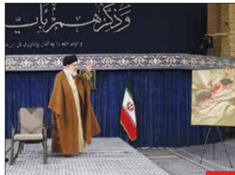
کایشن مهورتی/ اثر جدید حسن روح‌الامین از ریخته سلطانی‌نژاد دخترک ۱۸ ماهه‌ای که همراه با مادر و شش نفر دیگر از اعضای خانواده‌اش در حادثه تروریستی مسیر گلزار شهدای کرمان به شهادت رسید، برای اولین بار در حسینیه امام خمینی (ره) نمایش داده شد.