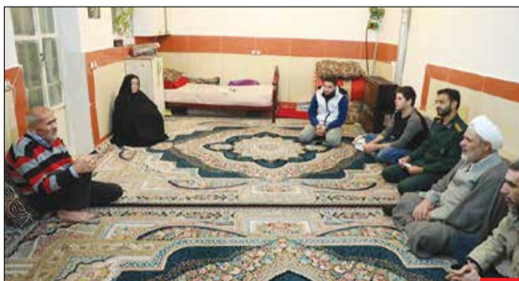
دیدار با خانواده شهید مصطفی محمدی