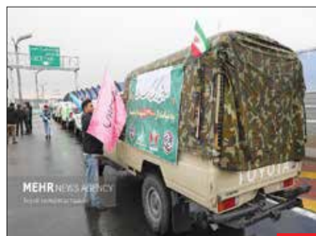
کرامت علوی/ رزمایش بزرگ «کرامت علوی» در آستانه کنگره ملی ۲۴ هزار شهید پایتخت و به نیابت از ۲۴ هزار شهید پایتخت در قالب ستون‌کنشی خودرویی، اهدای ۱۳۴ هزار بسته کمک مؤمنانه، ۱۰۲۴ سری جیب‌زیمه و ۲۴ هزار نوشت‌ابزار در پل طبقاتی صدر برگزار شد.