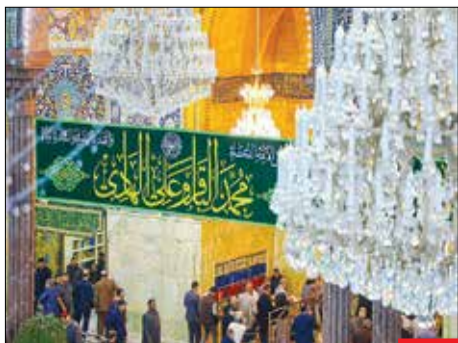
ابن‌الرجببون/ ماه رجب المرجب در دل کشورهای اسلامی عطر بوی دیگری دارد. بزرگان دین این ماه را ماه سالکان و عارفان می‌دانند چرا که این ماه، ماه خدایت و فرصت توشه برداشتن بندگان صالح. در روایت داریم که وقتی قیامت برپا شود منادی ابی‌فریاد می‌زند: «ابن‌الرجببون»!