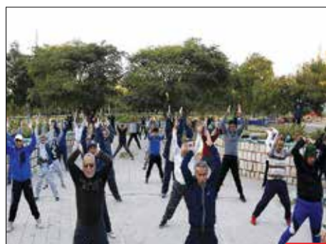
حال و روز یمن/ همه ما از بمب و آوار و جنگ در یمن خیر می‌شنویم، اما این مردم میبورد در کنار همه سختی‌های زندگی سعی می‌کنند روزگار خود را عادی بسپری کنند. تصویری از یک ورزش مباحگاهی در پارکی در صنعاء را می‌بینید.