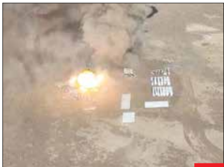
در تیسروس مشک، صهیونیست‌ها که تهدید حمله به ایران کرده بودند، وقتی تابودی ماکت پایگاه پالماخیم و هواپیماهای درون آن را دیدند، سوت‌زنان بخت را عوض کردند!