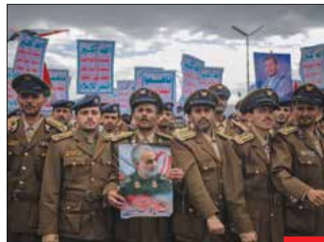
الگوی آزادگی، تصویری از فرماندهان بمبئی در میدان سعیدین این کشور در منغنا که قاب عکس شهید حاج قاسم سلیمانی را به دست گرفته‌اند. شهید سلیمانی از فرمانده سلیمانی زنده تر است.