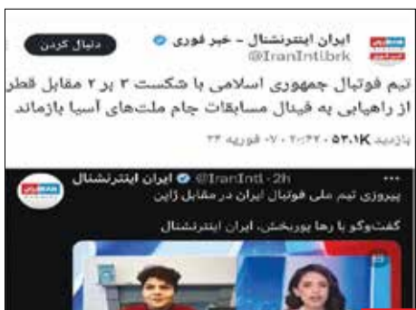
خودتی! اینترنت‌نشال وقتی تیم ملی ایران برنده میشه، اسم از ایران تنها می‌آورد و وقتی این تیم می‌بازد، نام از تیم جمهوری اسلامی می‌آورد! یک ذره شرافت خوب است.