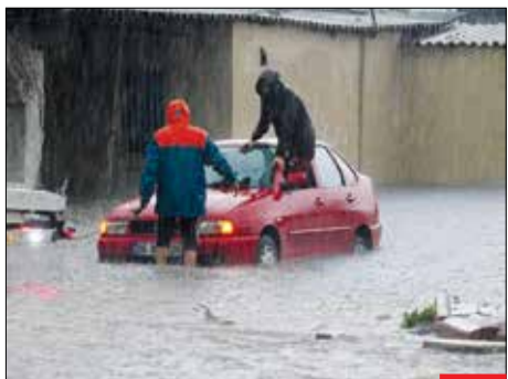
سبیل در اروپا، بارندگی شدید در ترکیه و اروپا، به جاری شدن سیل در این مناطق منجر شده است. مردم بسیاری از این کشورها در زمین‌ها ضعف امداد رسانی، از مقامات دولتی گله دارند.