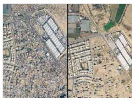
پلایی که بر سر رفح آمده است، عکس سمت چپ وضعیت فعلی رفح و چند ماه بعد از عکس سمت راست است. به حجم بنا هجویانی که از شر حملات صهیونیست‌ها چادر زده‌اند، توجه کنید.