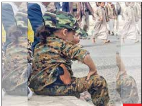
کودکان بمبئی، تصویری از دختر بمبی در حاشیه راهپیمایی حمایت از مردم فلسطین. بمبی‌ها که خود اوضاعی بهتر از فلسطینی‌ها ندارند، اما برادران و خواهران خود در غزه و... را فراموش نمی‌کنند.