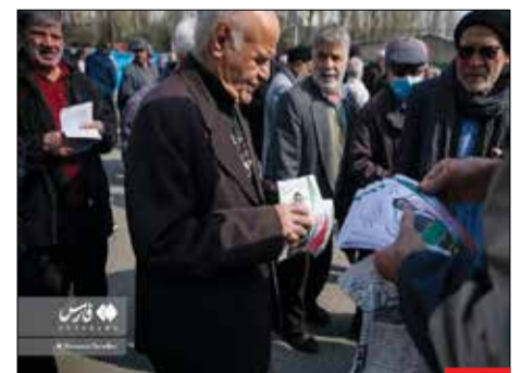
مارتن تبلیغات، تبلیغات انتخاباتی در حاشیه نماز جمعه تهران در مصلى امام خمینی(ره) برگزار شد. با شروع ایام تبلیغات، کاندیداهای انتخاباتی آخرین تلاش‌های خود برای جلب نظر مردم را انجام دادند.