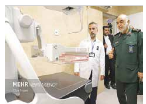
سپاه سازندگی، مرکز جراحی امام جعفرصادق(ع) گرگان با حضور سردار حسین سلیمی، فرمانده کل سپاه پاسداران انقلاب اسلامی با بخش‌های اورژانس، رادیولوژی، دندانپزشکی و اتاق عمل دندانپزشکی افتتاح شد و به بهره‌برداری رسید.