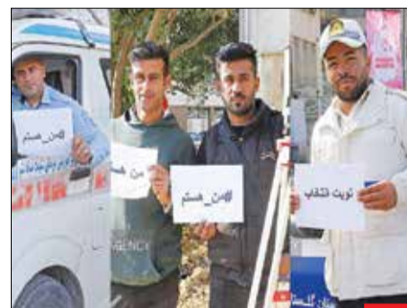
من هستم، پویش انتخاباتی مشارکت مردم در سنین گوناگون در هر شغل و با هر قومیتی برای انتخابات ۱۴۰۲ با شعارهای «من هستم»، «نوبت انتخاب» و «من رای می‌دهم» آغاز شد.