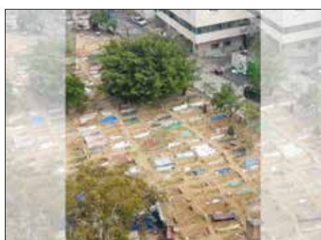
جنایت ماندگار! محوطه بیمارستان شفا در غزه به گورستانی برای دفن اجساد شهدا تبدیل شده است. جنایت صهیونیست‌ها در تاریخ ماندگار شد.