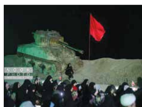
شب‌های بله‌برون، ویژه برنامه «شب‌های بله‌برون» در ایام راهیان نور با روایت‌گری حاج حسین یکتا به میزبانی شهدای عملیات کربلای ۵ در یادمان شلمچه برگزار می‌شود.