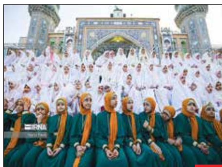
با مهدی، در آستانه نیمه شعبان و جشن‌های میلاد منجی عالم بشریت حضرت مهدی موعود(عج) سرود «عزیزم مهدی» با حضور جمعی از زائران و مجاوران در صحن مسجد مقدس جمکران اجرا شد.