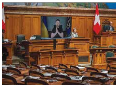
لاف در انزو/ ژنرالی که فرمان پوشالی غربی‌ها حتی در پارلمان‌های اروپا هم مشتري‌های خود را از دست داده است. تصویری از سالن خالی مجلس سنوبس هنگام خالی‌بندی‌های او را می‌بینید!