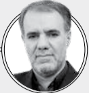
جریان شناس سیاسی

خط امام تعریف می‌کرد، تنها مرزبندی خود را با نیروهای سیاسی درون انقلاب پررنگ می‌کرد؛ اما از سوی دیگر که اتفاقاً با جریان‌های سکولار و آنهایی که به اسلام سیاسی و انقلابی اعتقادی نداشتند، مجاور بود، تلاش مشخصی برای مرزبندی هویتی با آنان نکرد.