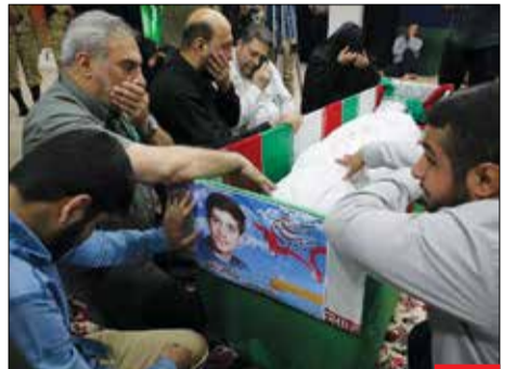
۴۰ سال دوری/ شهید والامقام عیسی شجاعی در ۱۸ سالگی در عملیات والفجر ۱ در منطقه فکه به درجه رفیع شهادت نائل آمد و پس از ۴۰ سال چشم انتظاری در آغوش بستگان آرام گرفت.