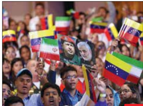
ژنرال‌ها/ در حاشیه حضور رؤسای‌جمهور ایران و ونزوئلا در اجتماع دانشجویان و جوانان ونزوئلایی، عکس شهید حاج قاسم سلیمانی در دستان یکی از دانشجویان خودنمایی می‌کند.

البته به فضل خدا در این جبهه هم با شکست مواجه خواهند شد.