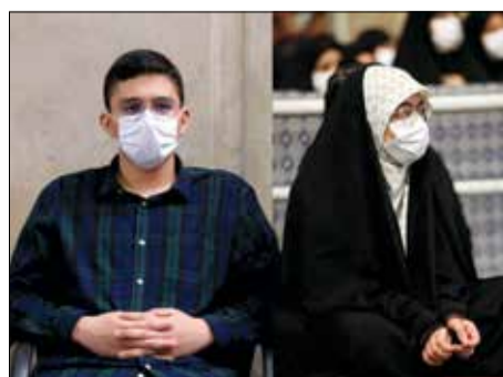
تصویری از حضور دختر شهید داریوش رضایی‌نژاد و پسر شهید احمدی‌روشن در دیدار دانشمندان و متخصصان، کارشناسان و مسئولان صنعت هسته‌ای کشور با رهبر معظم انقلاب در حسینیه امام خمینی(ره).