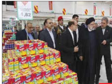
ساخت ایران/ سید ابراهیم رئیسی، رئیس‌جمهور کشورمان در حاشیه سفر خود به ونزوئلا از یک فروشگاه بزرگ محصولات مادرانی ایرانی با نام «مگاسیس» در کاراکاس بازدید کرد.