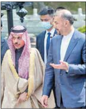
کارشناس بین الملل

فیصل‌بن‌فرحان، وزیر خارجه عربستان سعودی در حالی وارد تهران شد و مورد استقبال حسین امیرعبداللهیان، همتای ایرانی خود قرار گرفت که این اولین سفر وزیر خارجه سعودی پس از قطع روابط با ایران در سال ۱۳۹۴ است. تهران و ریاض اسفند ماه سال گذشته با وساطت چین در شهر پکن بر سر احیای روابط و بازگشایی سفارت‌خانه طی دو ماه، پس از چند دور مذاکرات در عراق و عمان به توافق رسیدند. سفر وزیر خارجه عربستان به تهران نشان می‌دهد، سردی روابط بین ایران و عربستان از بیسن‌رفته و دو کشور تمایل دارند به سمت عادی‌سازی و گسترش روابط دوجانبه و منطقه‌ای حرکت کنند.