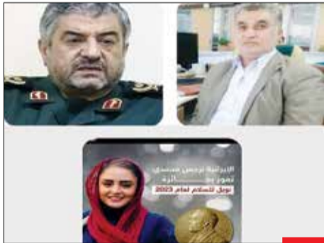
آخه اینقدر خنگ! : اینکه اسکای نیوز عکس نرگس محمدی را اشتباه گذاشته، بازم خوبه، به هر حال اسم هر دو یکیه! آمریکا یک بار جعفر عزیزی، خبرنگار صدا و سیما رو به جای عزیز جعفری، فرمانده وقت سپاه تحریم کرد! خنگ‌های عزیز، همیشه اولین نتیجه تو گوگل درست نیست!