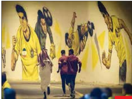
القرار : اعضای تیم فوتبال الاتحاد ایران که برای مسابقه به ایران آمده بودند، با بهانه الکی، مانند وجود تندیس سردار دل‌ها از بازی مقابل سپاهان ایران سر باز زدند و این‌گونه فرار را به فرار ترجیح دادند. عده‌ای حتی از مجسمه حاج قاسم هم می‌ترسند!