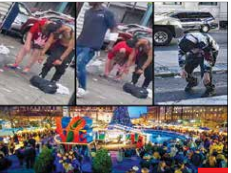
قدرت رسانه! : خیلی از مردم دنیا وقتی اسم فیلادلفیا و شهرهای دیگر آمریکا را می‌شنوند، تصویر پابینی در ذهن‌هایشان نقش می‌بندد؛ اما فیلادلفیای واقعی تصاویر بالا هستند که رسانه با قدرت خود چهره‌های بزرگ کرده از آن را به جهانیان نمایش می‌دهد!