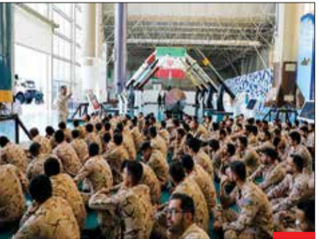
نمایش قدرت : سربازان ستاد نمایندگی ولی فقیه در سپاه از نمایشگاه ملی هوا فضای سپاه جمهوری اسلامی ایران در تهران بازدید کردند. در این نمایشگاه جدیدترین دستاوردهای صنعت دفاعی کشور برای تماشا و کسب اطلاعات بیشتر وجود دارد.