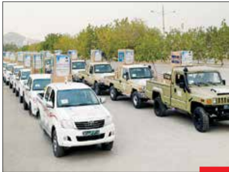
۲۰ هزار جهبیزه : در مراسمی با حضور سردار «حسین سلامی» فرمانده کل سپاه پاسداران انقلاب اسلامی و «سیدمرتضی یخبختری» رئیس کمیته امداد امام خمینی(ره) که در مشهد برگزار شد، ۲۰ هزار و ۳۱۳ سری جهبیزه به نیازمندان واقعی اهدا شد.