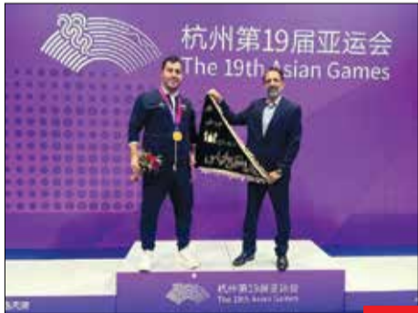
همراه همیشگی : اعضای تیم ملی کاراته ایران در مراسم اهدای مدال‌های این مسابقات، پرچم حضرت ابوالفضل العباس(ع) را که در چند سال اخیر همواره همراه تیم ملی کاراته بوده است، به اهتزاز در آوردند. این پرچم از گرلا تهیه شده و حتی در المپیک ۲۰۲۰ توکیو هم در کنار ملی‌پوشان بوده است.